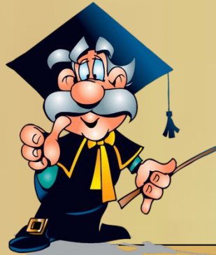
Схема предложения строится следующим образом: