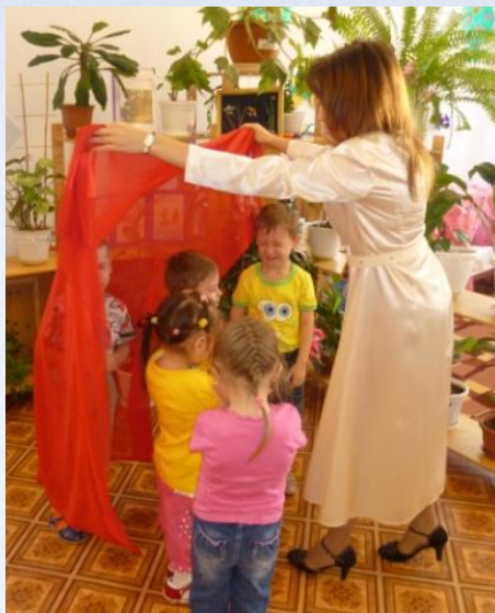
Коррекционно-развивающее занятие «Путешествие в страну сказок»