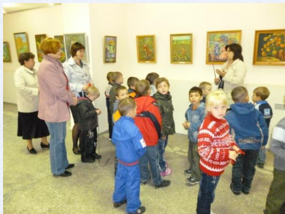
Экскурсия в «Выставочный зал»