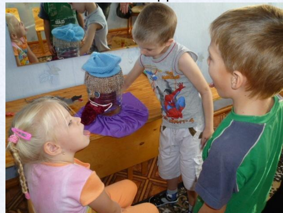
Самостоятельная деятельность детей