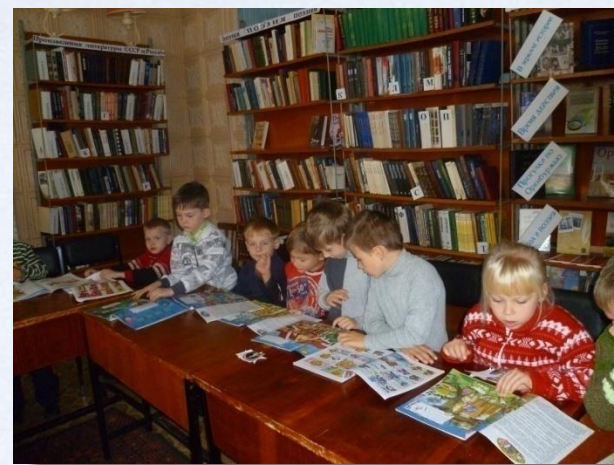
Экскурсия в библиотеку