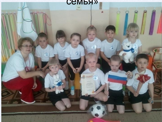
Спортивное развлечение «Мы - будущие олимпийцы»