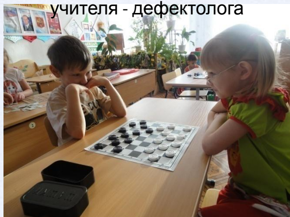
Шашки – это интересно!