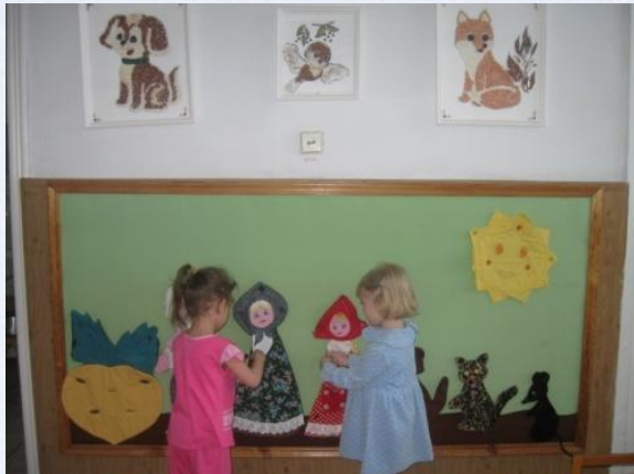
«В гостях у сказки»