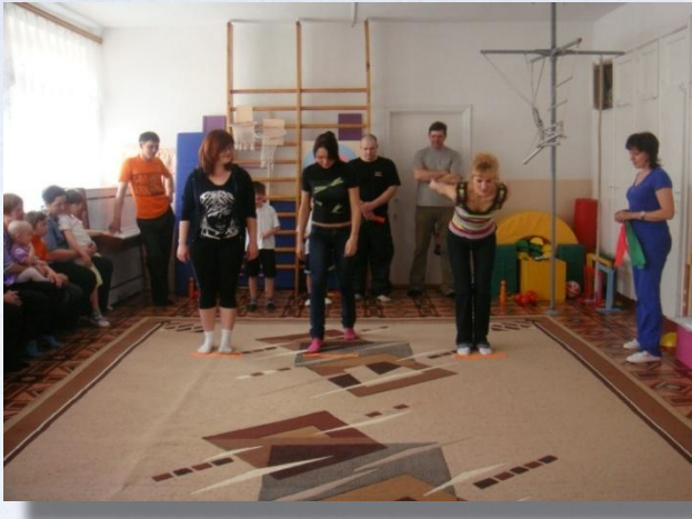
«Мама, папа, я спортивная семья»