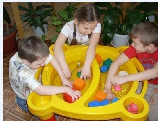
Опытно-экспериментальная деятельность детей