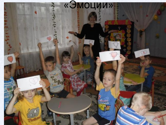
Подгрупповое занятие педагога-психолога по теме «Эмоции»