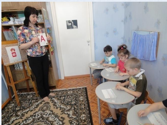
Подгрупповое занятие учителя - логопеда