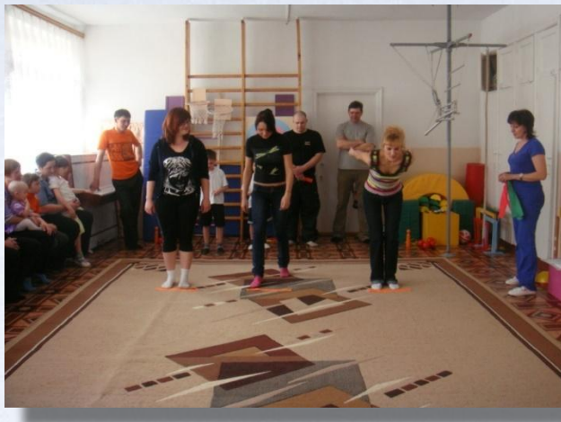
«Мама, папа, я спортивная семья»