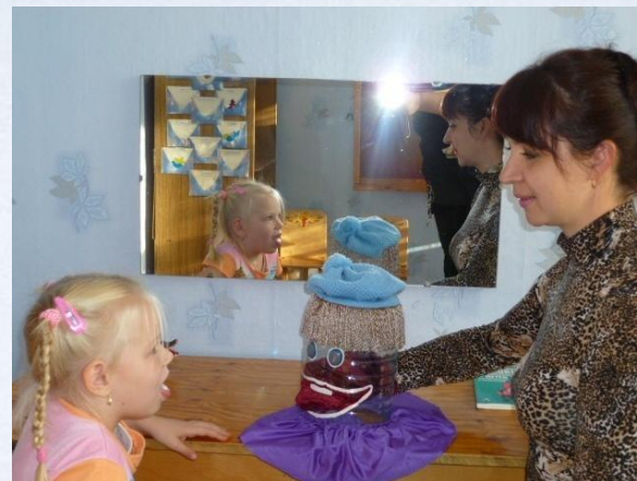
Индивидуальная работа учителя - логопеда