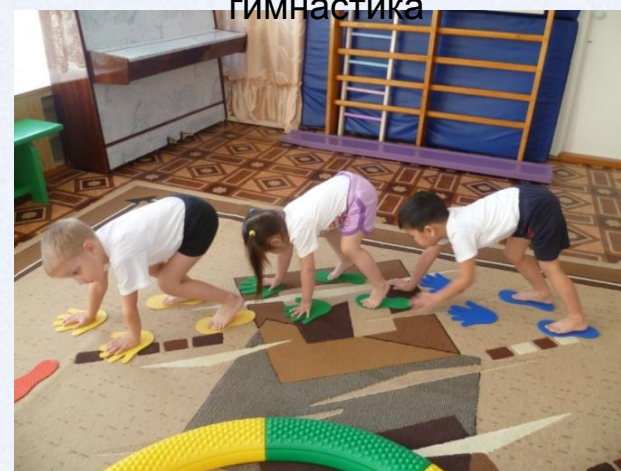
Корректирующая гимнастика после сна