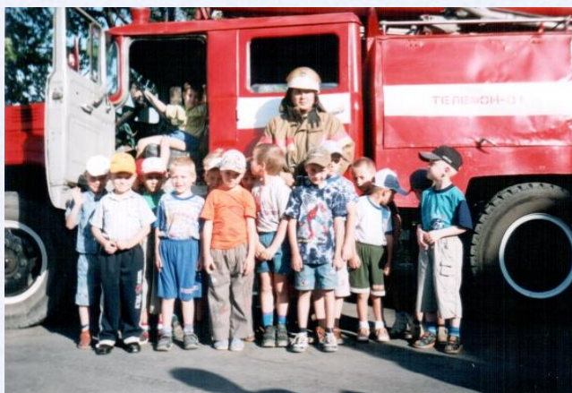
Экскурсия в пожарную часть