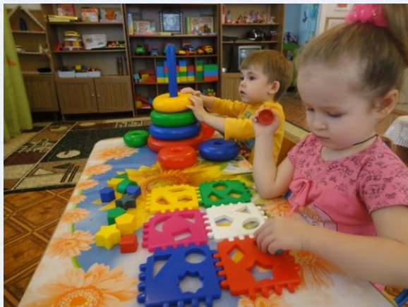
Развитие мелкой моторики