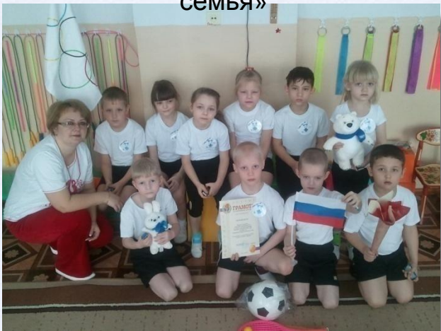
Спортивное развлечение «Мы - будущие олимпийцы»