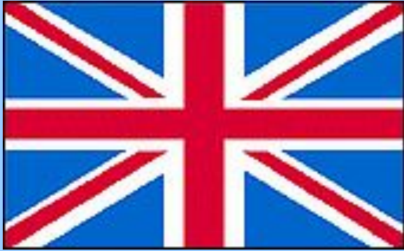
Соединённое Королевство Великобритании и Северной Ирландии