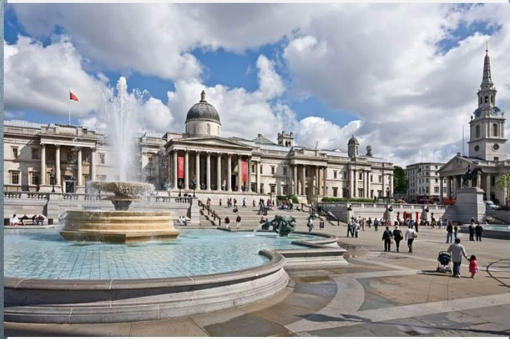
Достопримечательности Великобритании - Трафальгарская площадь