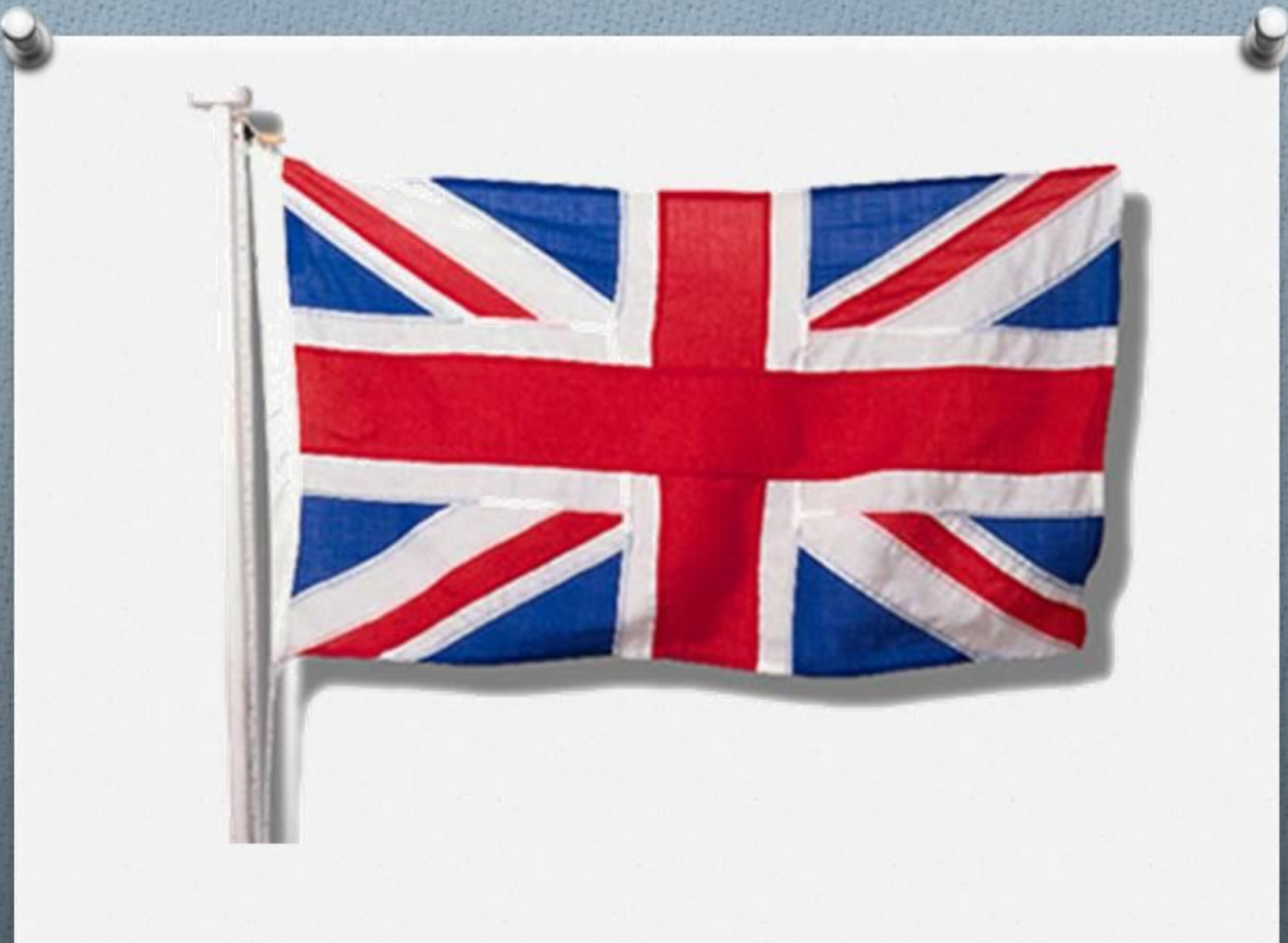
Флаг Великобритании - синее полотно с красными перекрещивающимися полосками.