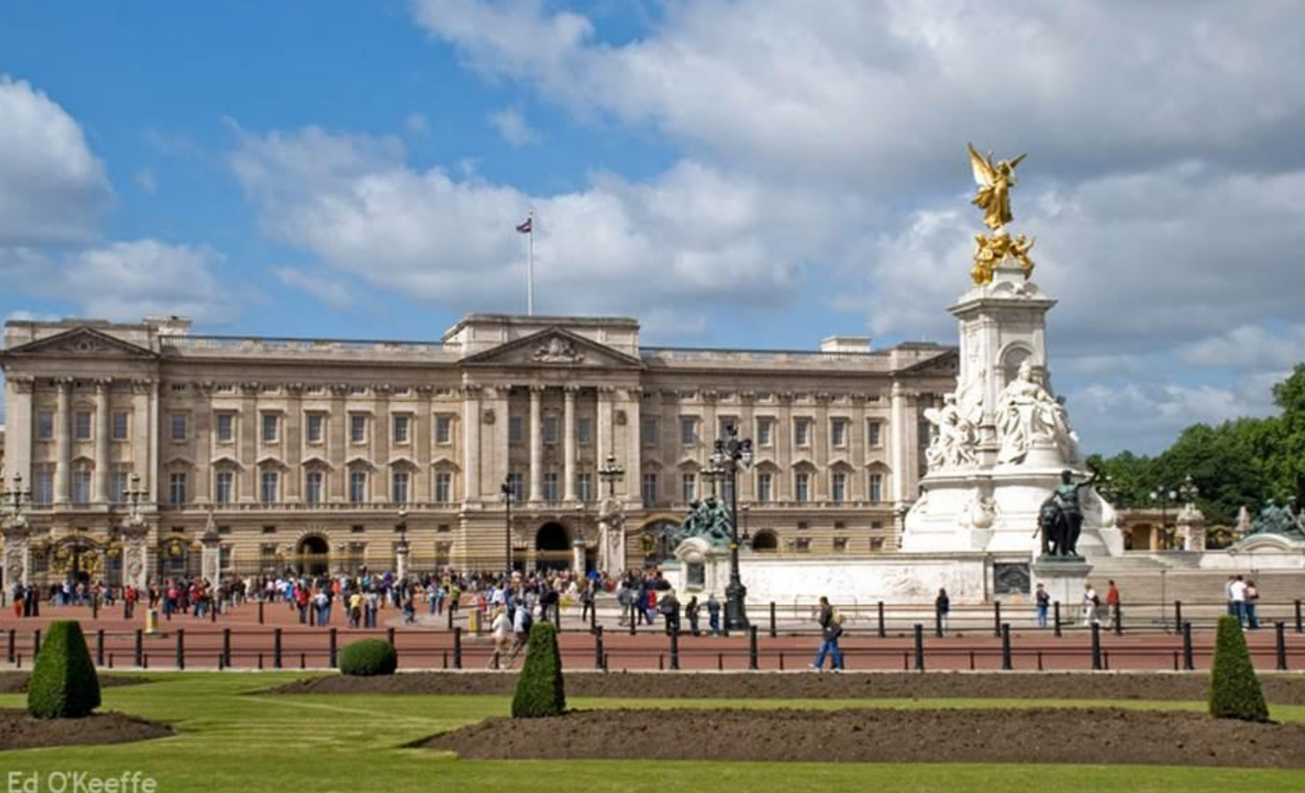
Королевская резиденция - Букингемский дворец