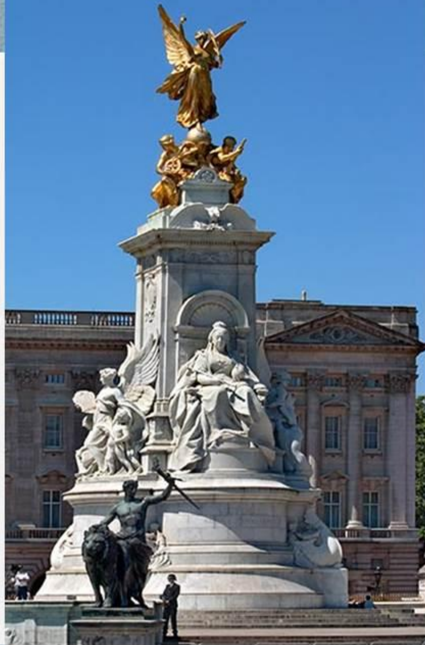
На площади возле дворца находится мемориал Королевы Виктории