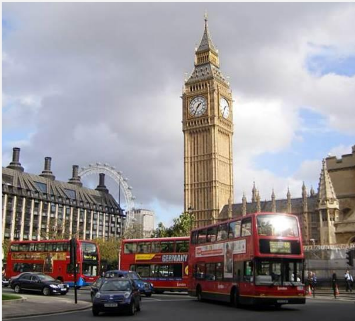
Старинная башня с часами Биг Бен (Big Ben)