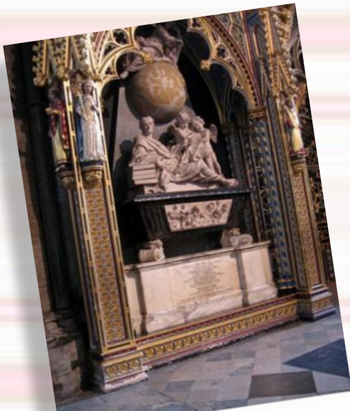
Могила Ньютона в Вестминстерском аббатстве