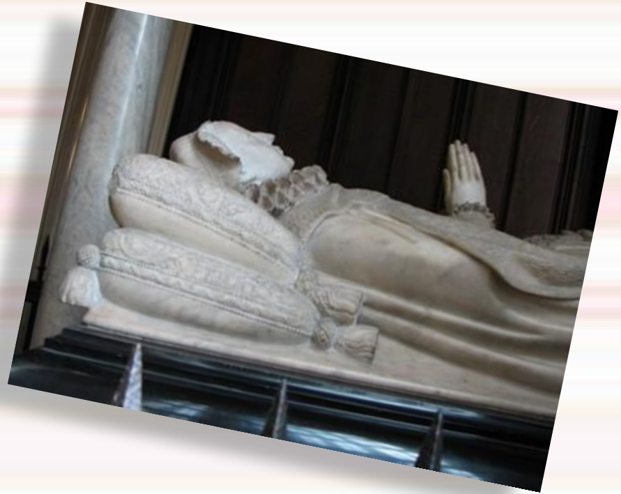
Надгробие Могила Марии Стюарт в Вестминстерском аббатстве.