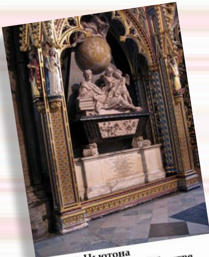
Могилы Могилы Ньютона в Вестминстерском аббатстве