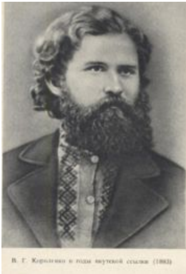
В. Г. Короленко в годы вынужденной ссылки (1882)