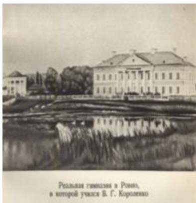
Реальная гимназия в Риме, в которой учился В. Г. Короленко

Творчество Короленко отличают страстная защита обездоленных, мотив стремления к лучшей жизни для всех, воспевание душевной стойкости, мужества и упорства, высокий гуманизм.