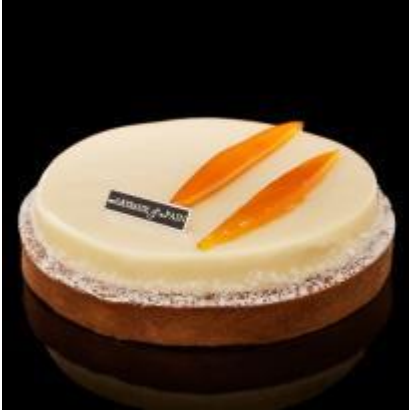
Cheese cake pamplemousse