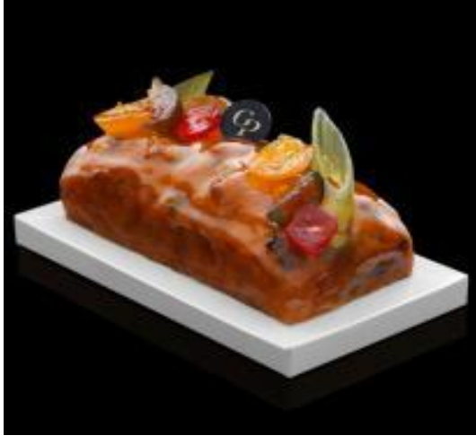
Cake aux fruits confits