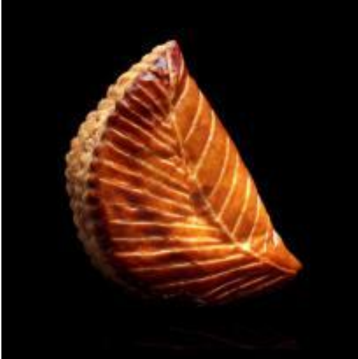
Chausson aux pommes