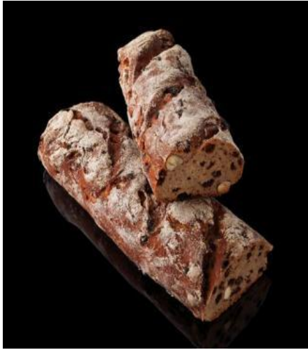
Pain de seigle aux fruits secs