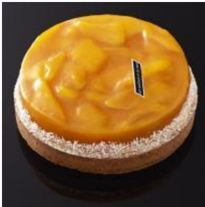
Mangue et vanille de Tahiti