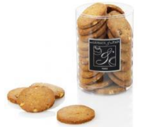
Sablés praliné aux noisettes