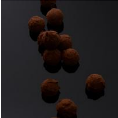
Truffes au chocolat