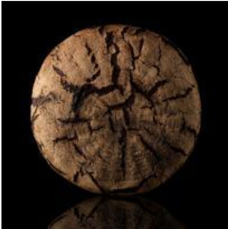
Tourte de seigle