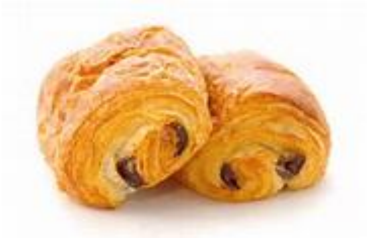
Pain au chocolat