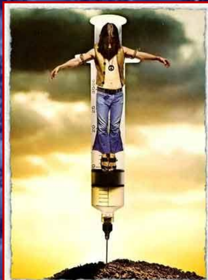
1971 г. "Современное распятие". Из ж-ла Mad, сент. 1971. www.collectmad.com/madcoversite/crucifixion.html