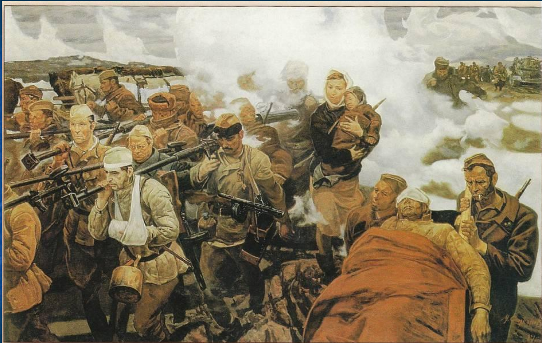
М.И.Самсонов. В боях за Отчизну. 1987