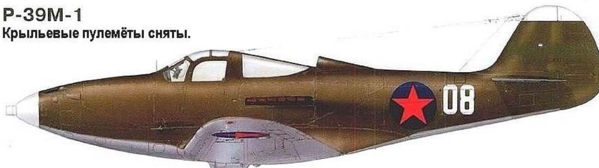
P-39M-1 из состава 2-го Гвардейского ИАП ВВС СФ. Апрель - май 1943 года.