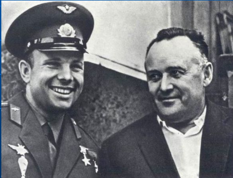
Ю. А. Гагарин и С. П. Королев