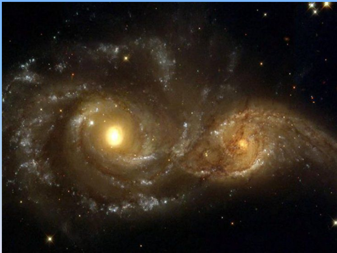
Галактик и .

Галактика, в которой находится наша планета называется Млечный путь