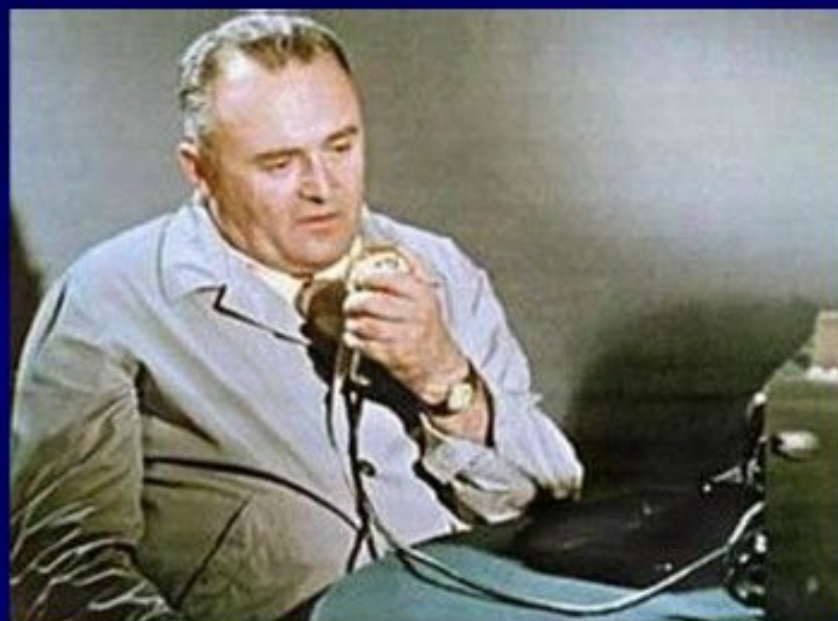
Сергей Павлович Королев (1906 -1966)

Российский учёный и конструктор. Под его руководством были созданы баллистические и геофизические ракеты, первые искусственные спутники Земли, первые космические корабли, на которых впервые в истории совершены космический полёт человека и выход человека в космос.