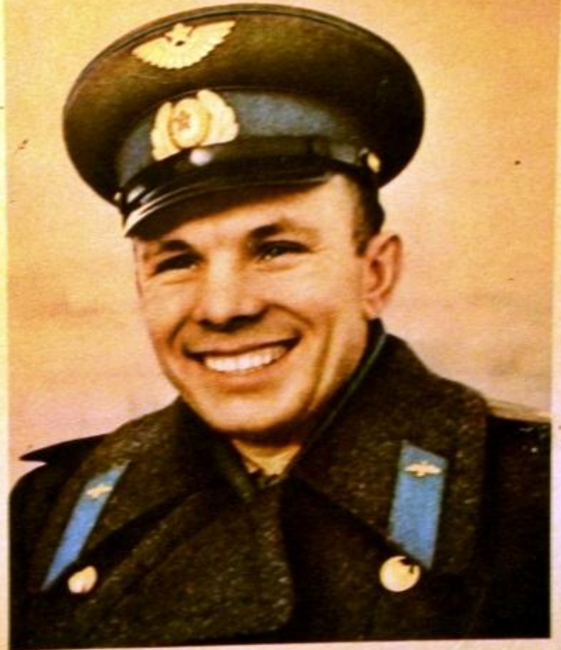
Первый человек, проникший в космос, — гражданин Союза Советских Социалистических Республик Герой Советского Союза летчик-космонавт СССР Юрий Алексеевич ГАГАРИН.