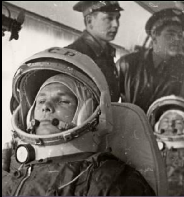
Ю.А. Гагарин в салоне автобуса, направляющегося на стартовую площадку. За ним в кресле Г.С. Титов, стоит Г.С. Нестов, А.Л. Николаев. 12 апреля 1961 г. Повесть Тере-Тех.

Началось заседание Государственной комиссии. Оно было очень коротким: "все готово".