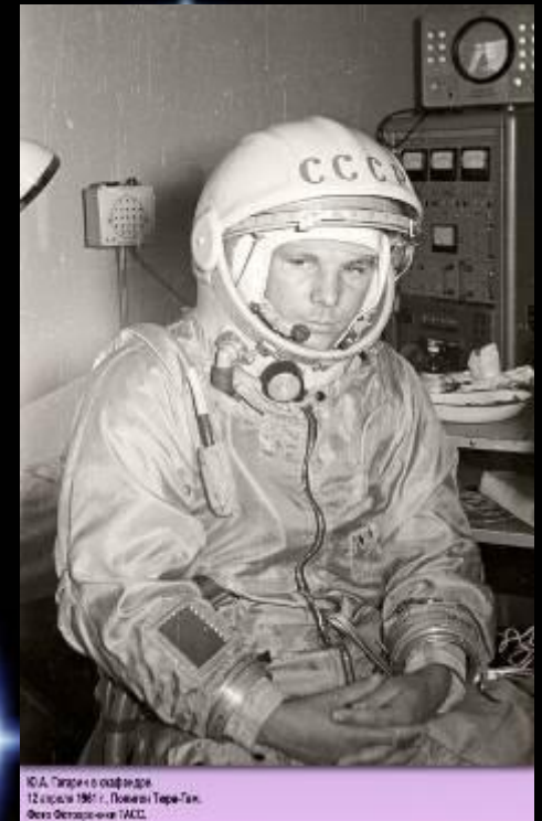
Ю.А. Гагарин в скафандре. 12 апреля 1961 г. Повесть Тере-Тан.

Через несколько минут специальный автобус голубого цвета уже мчался к стартовой площадке.