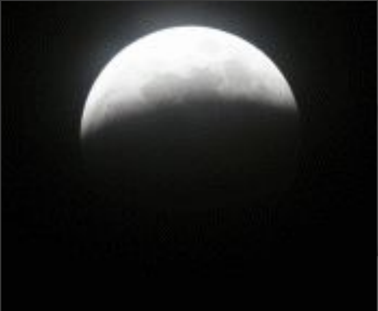
Вид Луны при лунном затмении, проходящем через полную фазу