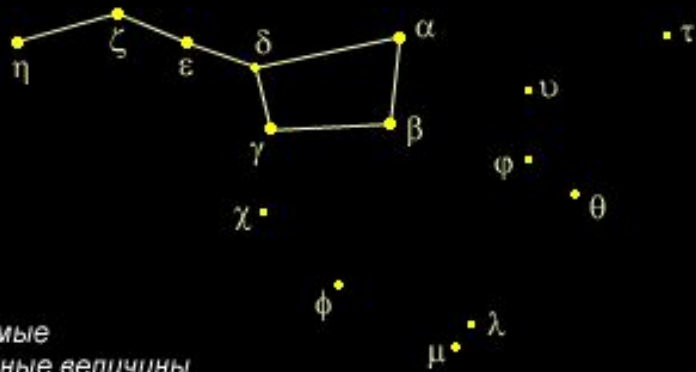
Видимые звездные величины