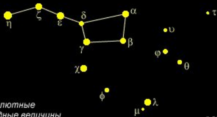
Абсолютные звездные величины

Для определения истинного блеска звезды вводят понятие абсолютной звездной величины