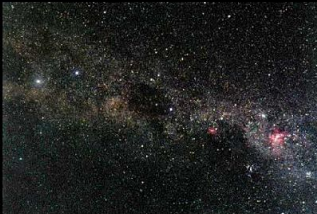
Млечный Путь в районе Южного Креста

Невооруженным глазом на небе можно наблюдать менее 6 000 звезд (вплоть до шестой звездной величины), с помощью телескопов – миллиарды миллиардов. В астрономии вместо выражения «освещенность от звезд» используют понятие блеск.