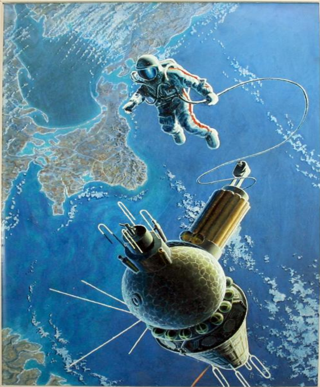
А. ЛЕОНОВ, А. СОКОЛОВ "Рабочее место - открытый космос"

"Если уйти на расстояние 40-50 тысяч от Земли, то теряется радуга, - рассказывает летчик-космонавт СССР, дважды Герой Советского Союза Алексей Леонов. - И мы видим Землю, а вокруг нее скучный белый ободок".