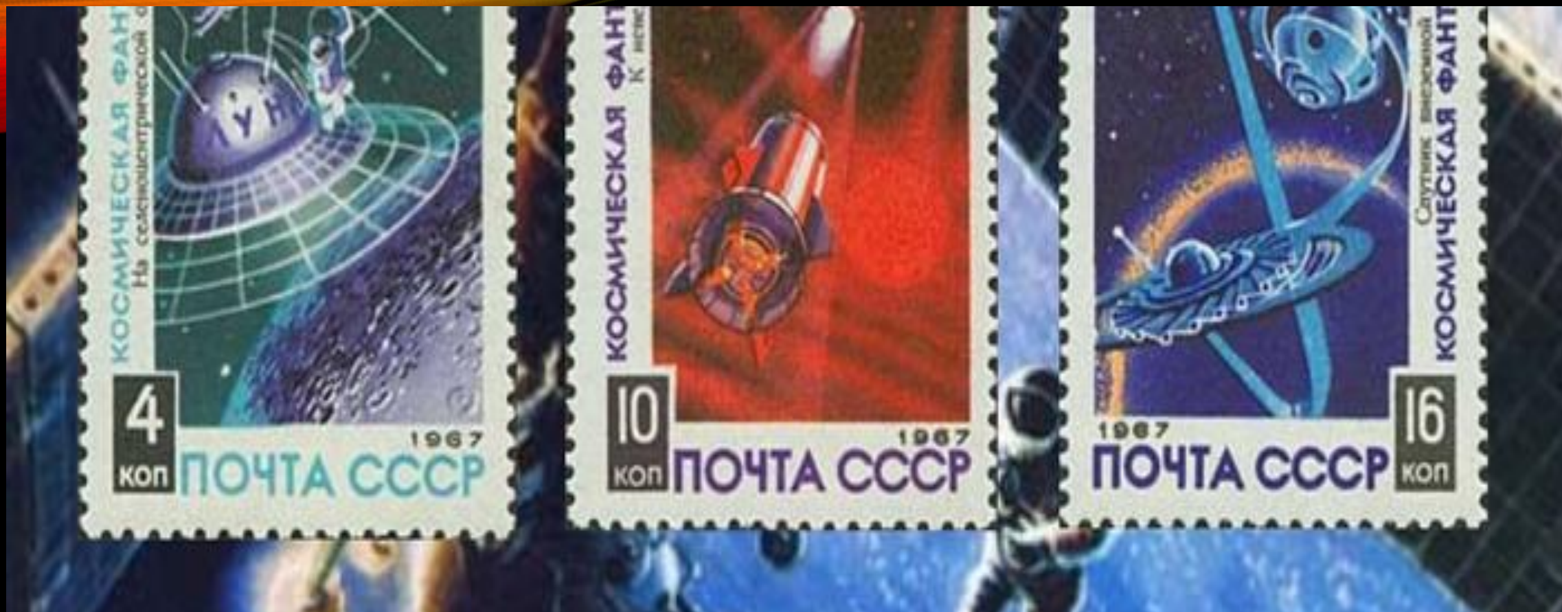
Марки с изображениями космоса А. Соколова