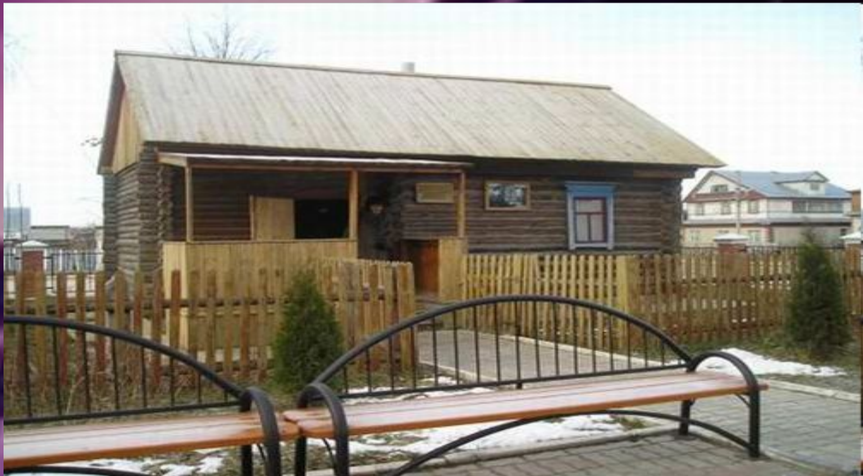
Дом Андриана Григорьевича Николаева в Шоршелах