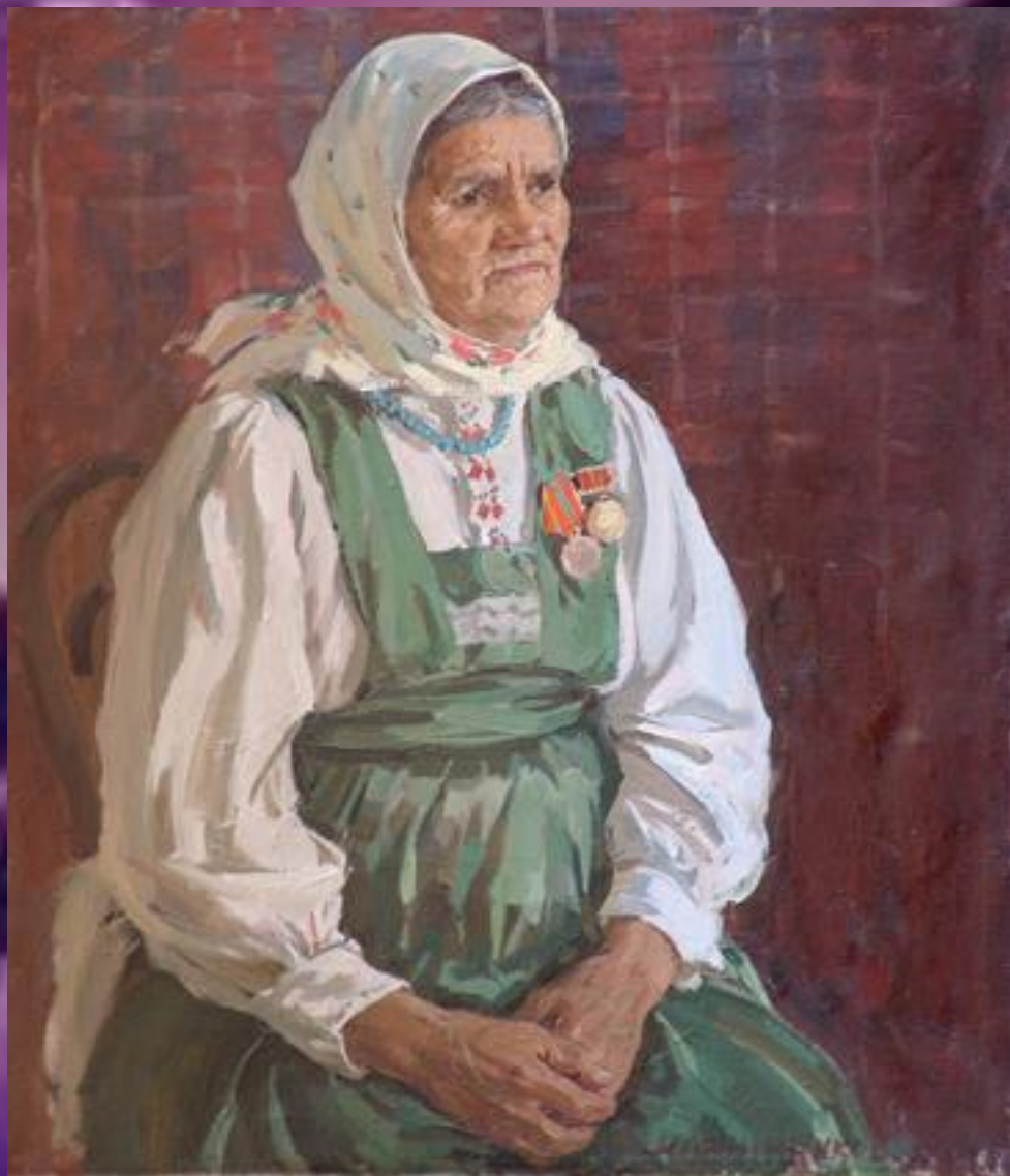
Портрет матери космонавта Анны Алексеевны Николаевой