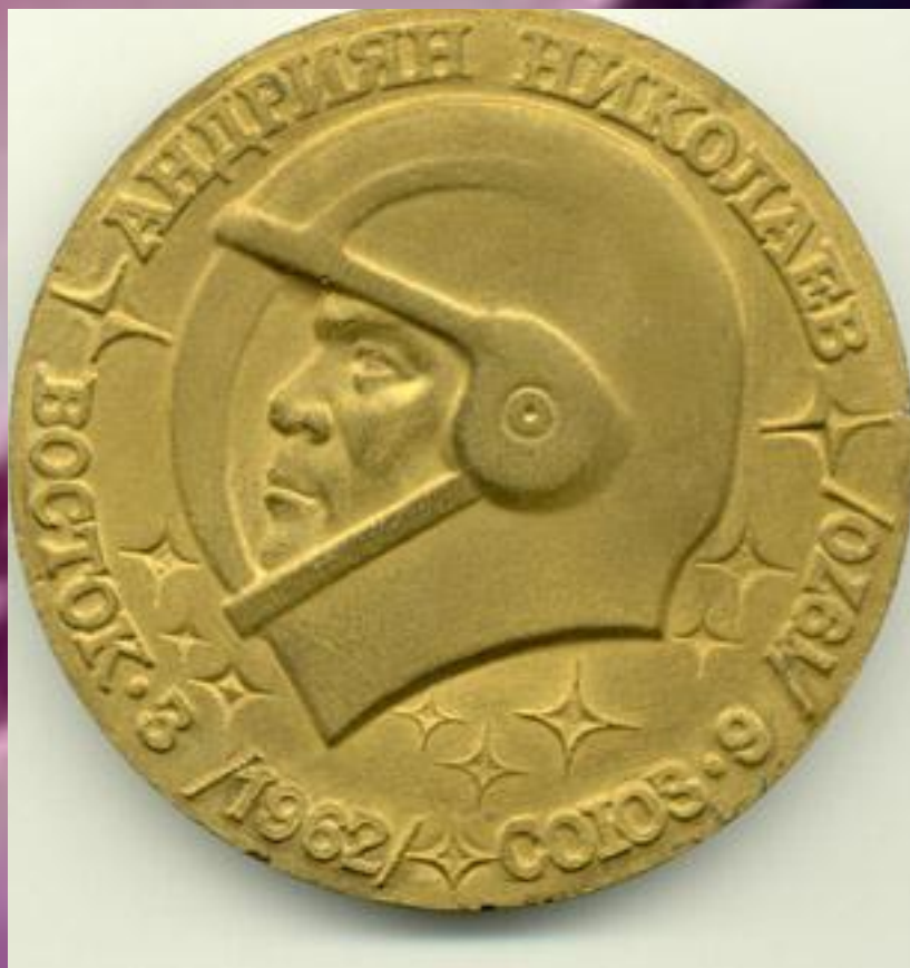
Модель монеты "Андрян Николаев. "Восток-3" (1962), "Союз-9" (1970)". 1990 г.