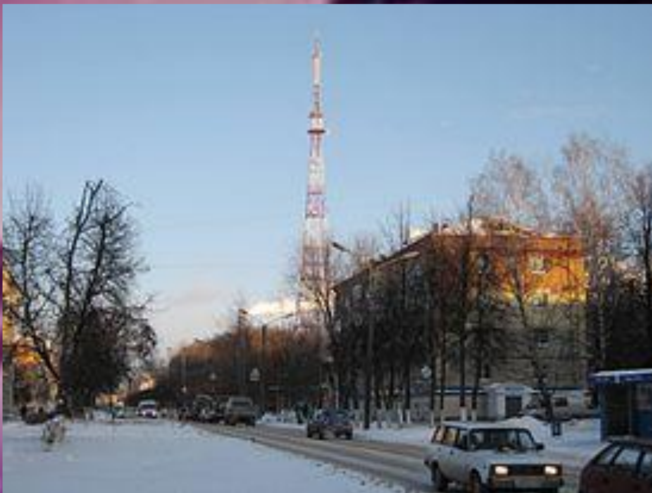
Улица космонавта Николаева