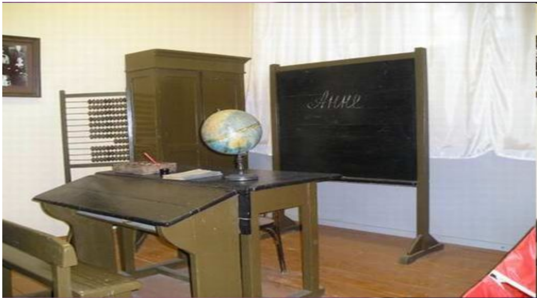
Парта, за которой учился А.Г. Николаев