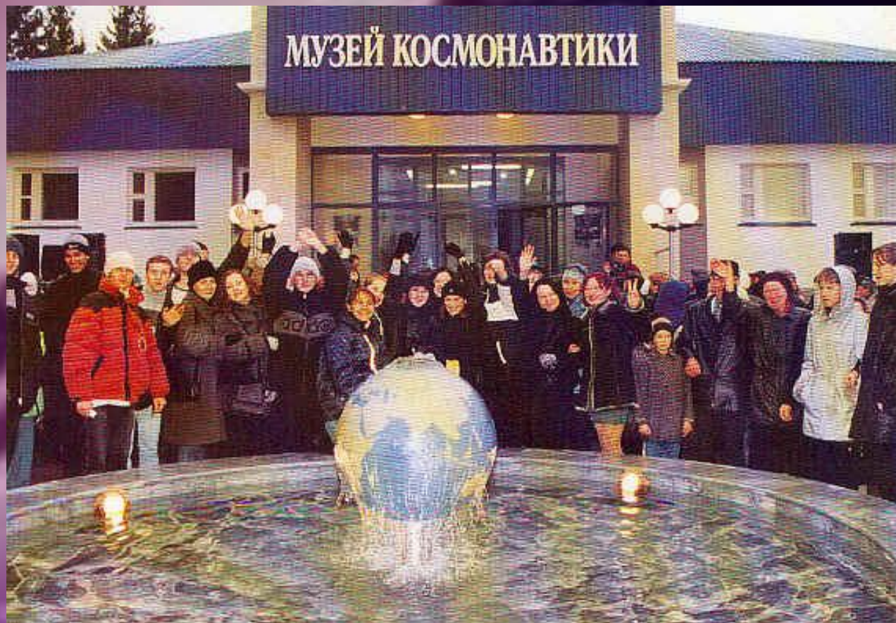
МУЗЕЙ КОСМОНАВТИКИ В ШОРШЕЛАХ