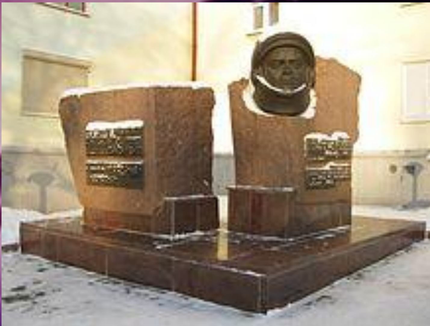
Памятник А.Г.Николаеву на пересечении с проспектом Ленина