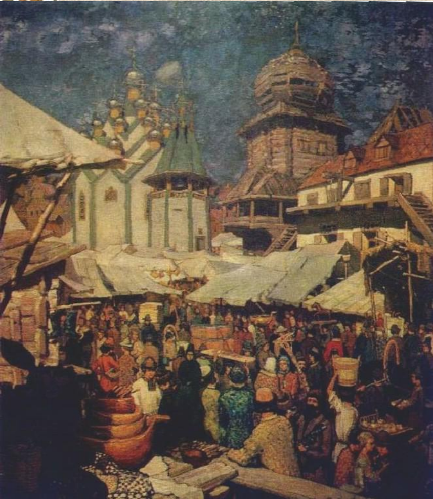
Базар XVII века