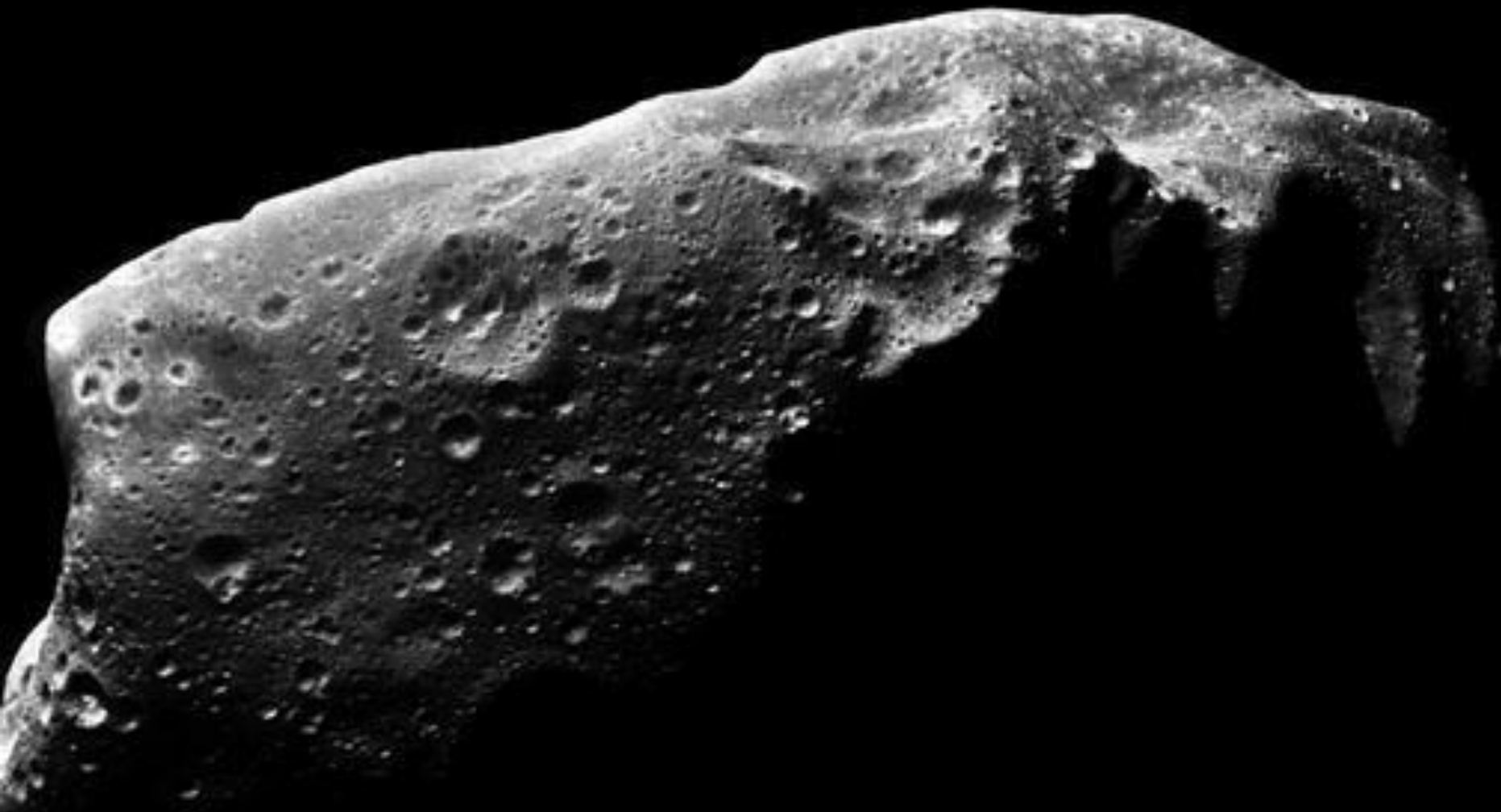
Астероид 243 Ида (изображение АМС "Галилео")