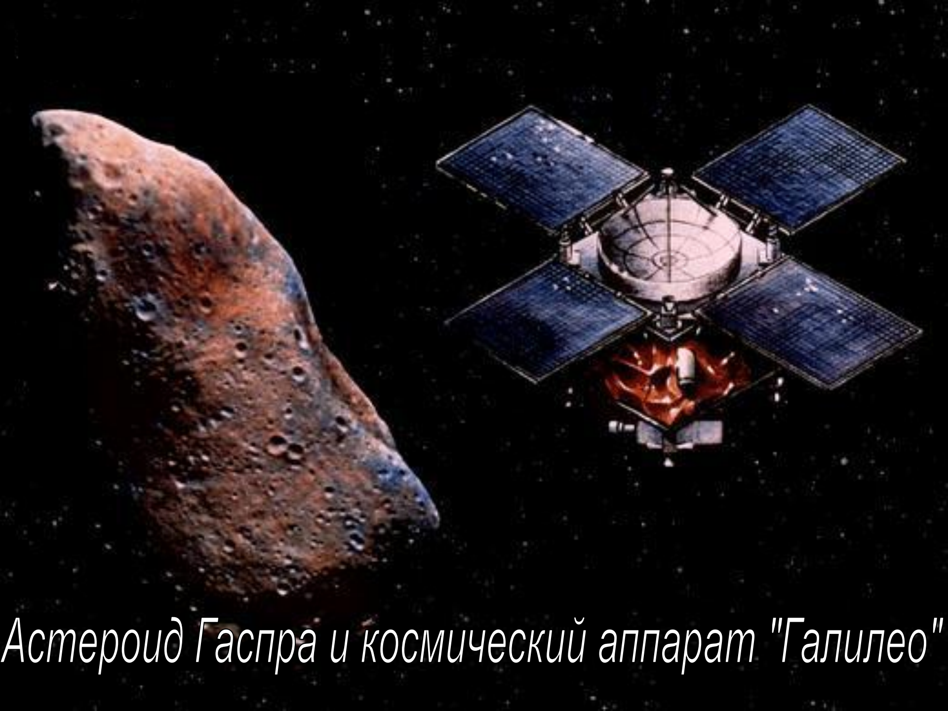
Астероид Гаспра и космический аппарат "Галилео"