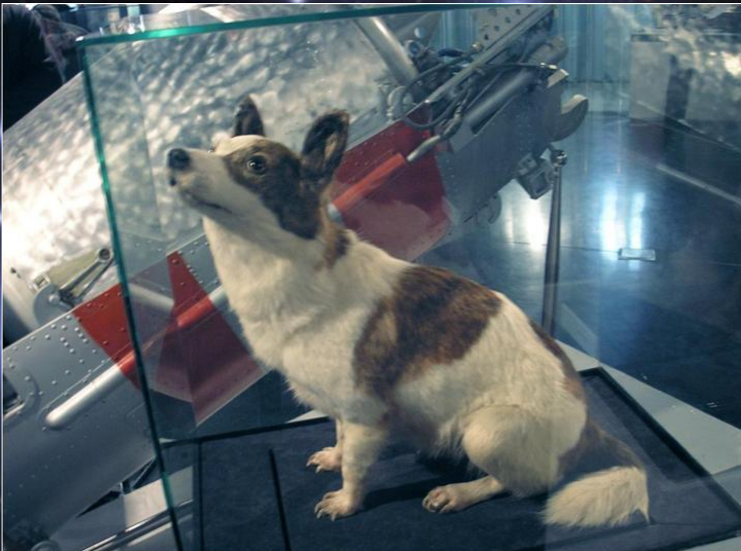
Стрелка в Музее Космонавтики