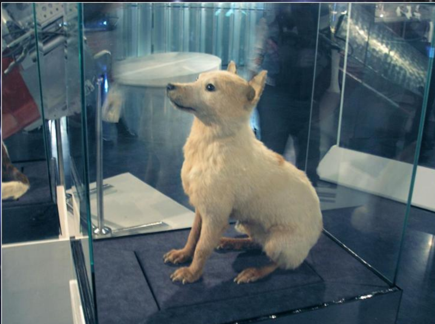
Белка в Музее Космонавтики