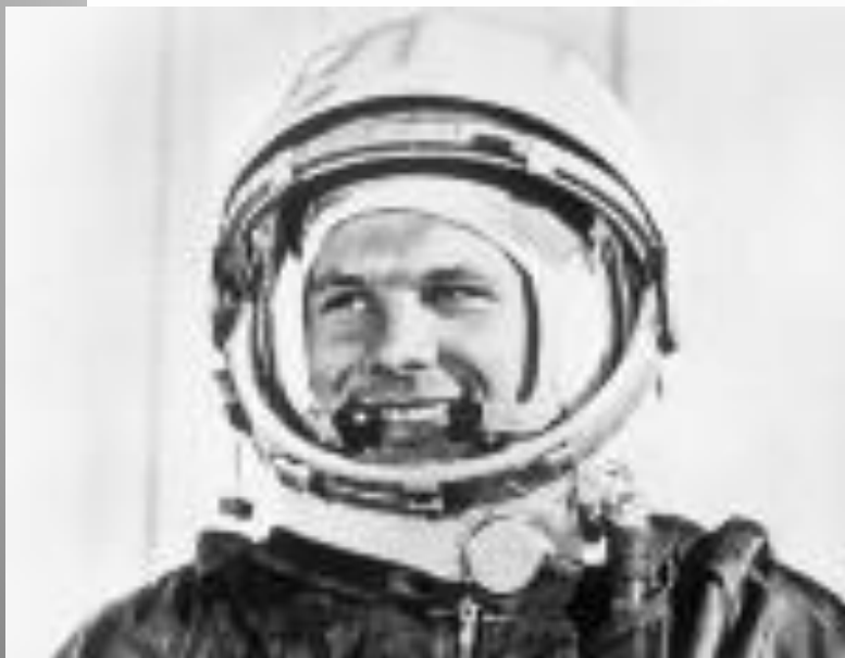
Исторические слова Юрия Гагарина

Облетев Землю в корабле-спутнике, я увидел, как прекрасна наша планета. Люди, будем хранить и приумно- жать эту красоту, а не разру- шать её! Гагарин -