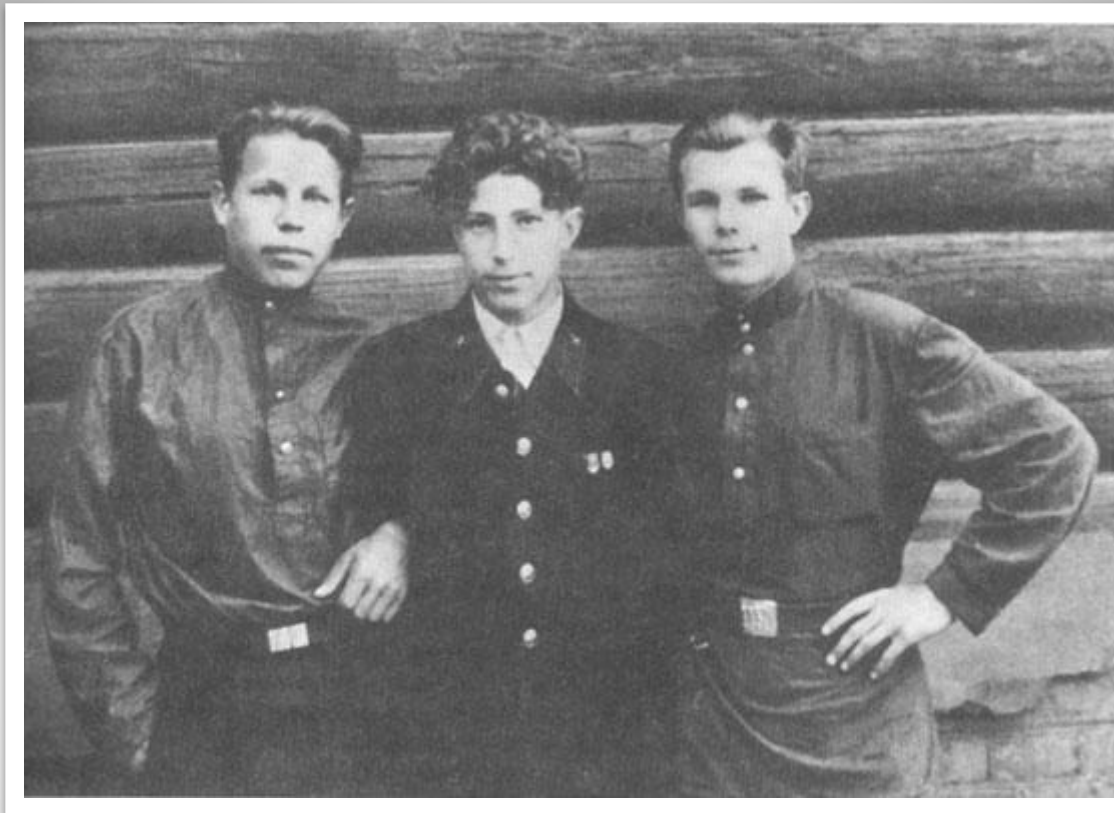
Юрий Гагарин со своими друзьями по ремесленному училищу. Люберцы. 1951 г.

В 1951 году Гагарин на “отлично” закончил училище и седьмой класс вечерней школы. Учебу решил продолжить в Саратовском техникуме, куда был зачислен без экзаменов как отличник.