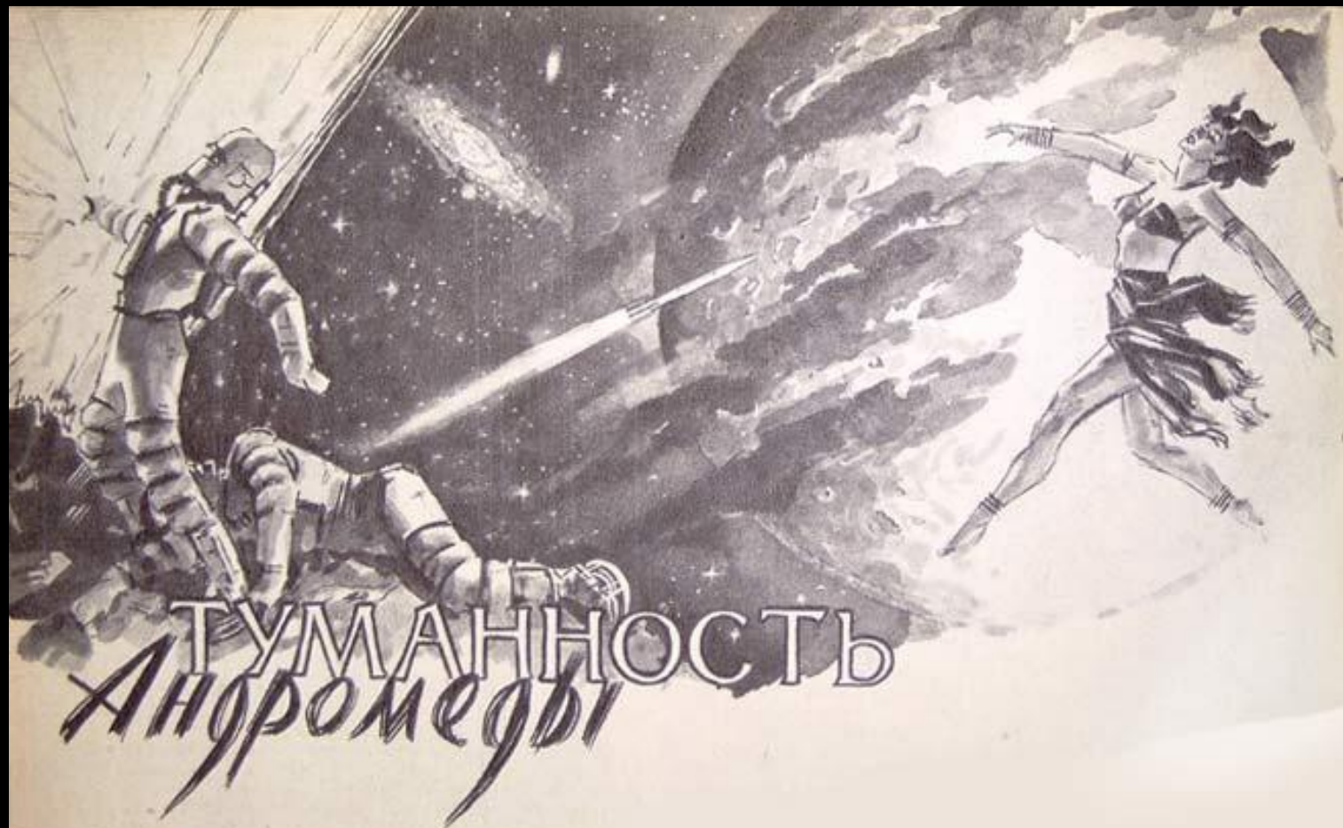
«Туманность Андромеды» 1957 г.