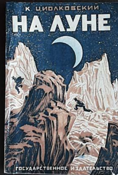
Иллюстрация из повести Циолковского “На Луне”