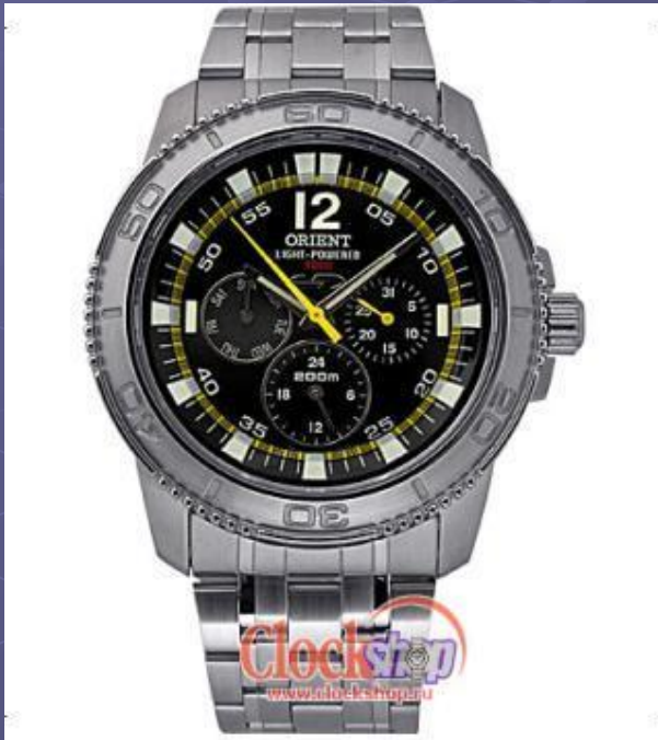
Часы, работающие на солнечной энергии