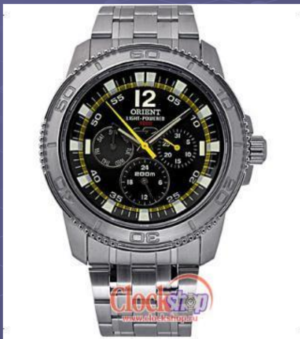
Часы, работающие на солнечной энергии