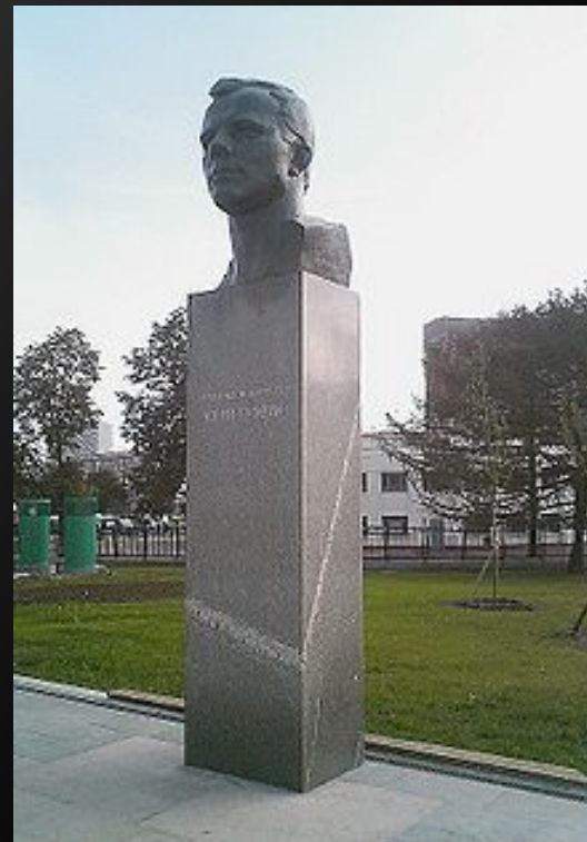
Памятник Юрию Гагарину на аллее Космонавтов в Москве

Имя Гагарина носят учебные заведения, улицы и площади многих городов мира. Именем Гагарина назван кратер на обратной стороне Луны.