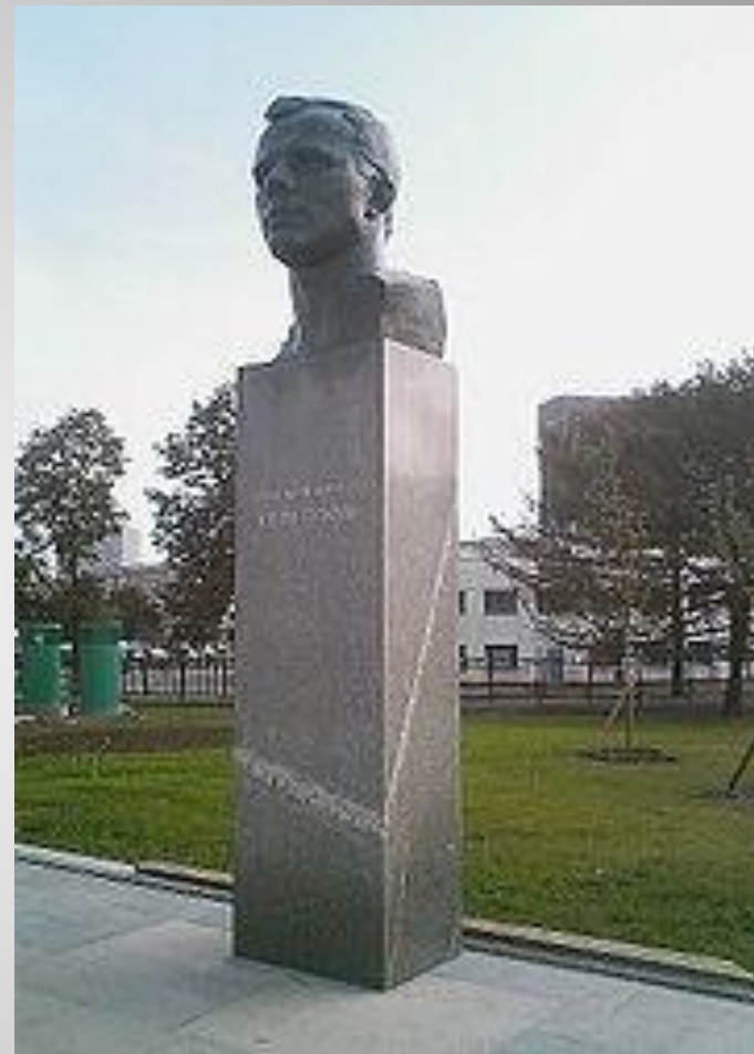
Памятник Юрию Алексеевичу Гагарину в Москве, Россия

Ю.А.Гагарин - кавалер общественного ордена «Гордость России» (посмертно), учрежденного благотворительным фондом «Гордость Отечества».