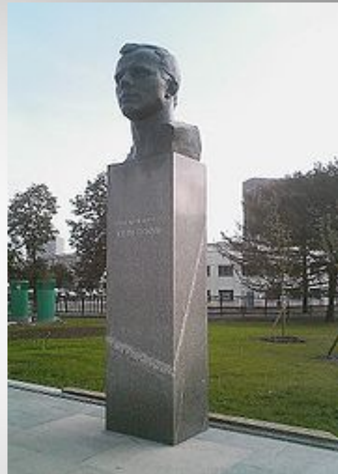
Памятник Юрию Алексеевичу Гагарину в Москве, Россия

Ю.А.Гагарин - кавалер общественного ордена «Гордость России» (посмертно), учрежденного благотворительным фондом «Гордость Отечества».