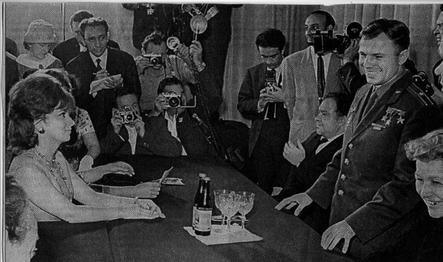
Июль 1961 года. Актриса Джина Лоллобриджида встретила с Юрием Гагариным на II Московском кинофестивале