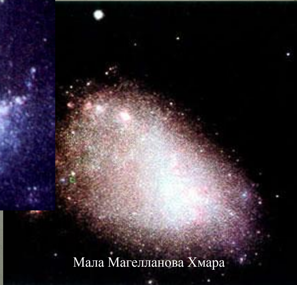
Мала Магелланова Хмара