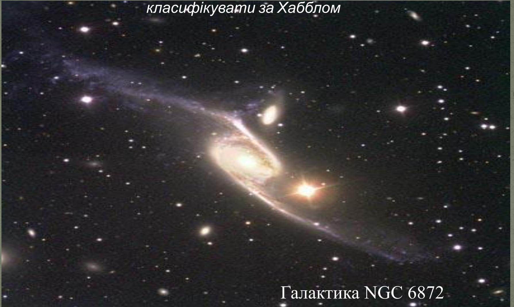
Галактика NGC 6872

У ХХ столітті великі телескопи виявили, що 5-10% від загального числа галактик мають дуже дивний, спотворений вигляд, так що їх важко класифікувати за Хабблом