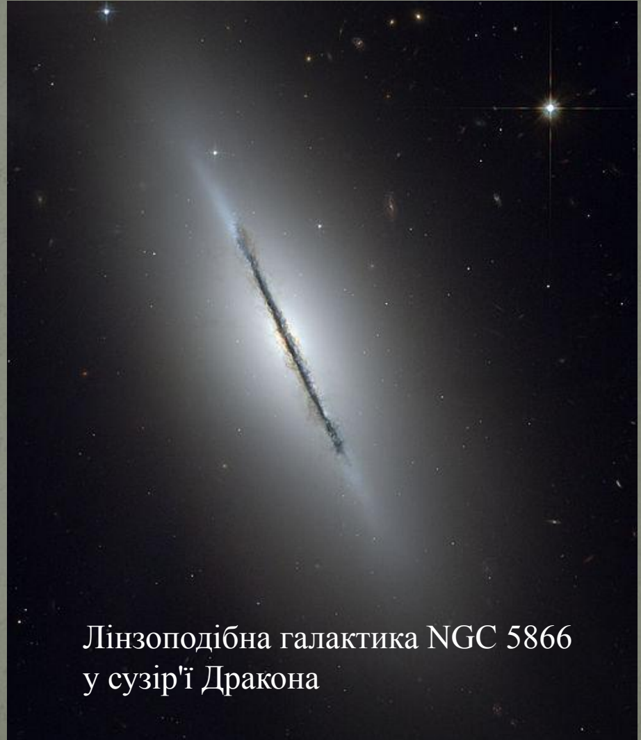
Лінзоподібна галактика NGC 5866 у сузір'ї Дракона

галактика — тип галактик, проміжний між еліптичними та спіральними в класифікації Хаббла. Лінзоподібні галактики — це дискові галактики (як і, наприклад, спіральні), які витратили свою міжзоряну матерію. Характерною особливістю лінзоподібних галактик є ступінчасте зменшення яскравості від центру до периферії.