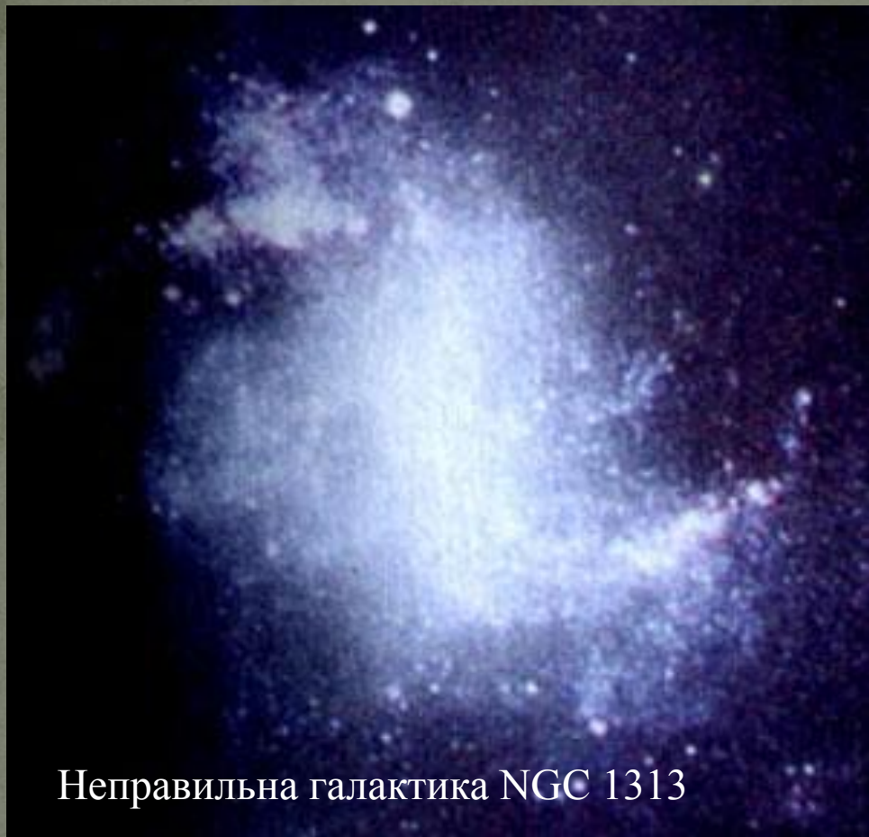
Неправильна галактика NGC 1313