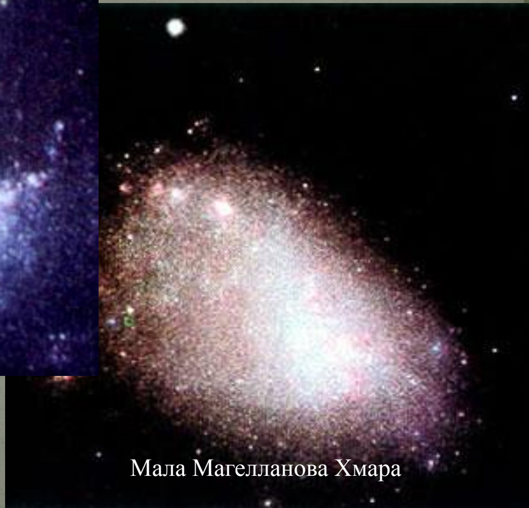
Мала Магелланова Хмара