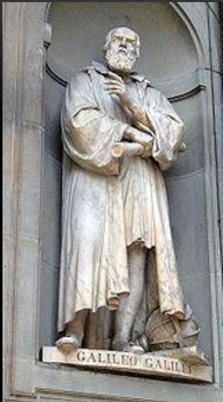
Гробница Галилео Галилея. Собор Санта Кроче, Флоренция