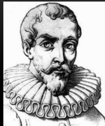
Гвидобальдо дель Монте

Монте сразу оценил выдающиеся способности молодого ученого и, занимая высокий пост генерал-инспектора всех крепостей и укреплений в герцогстве Тосканском, смог оказать Галилею важную услугу: по его рекомендации в 1589 последний получил место профессора математики в том самом Пизанском университете, где ранее был студентом.