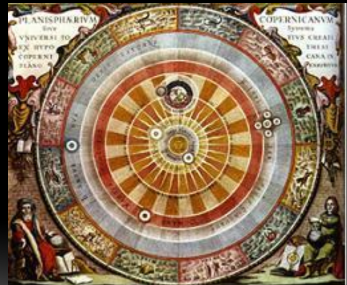
Система Мира Коперника

Вероятно, в эти годы он познакомился с теорией Коперника, которая в те годы не была ещё официально запрещена. Астрономические проблемы тогда живо обсуждались, особенно в связи с только что проведённой календарной реформой.