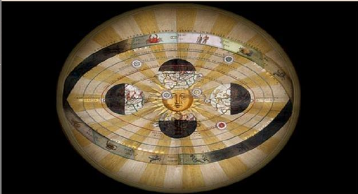
Гелиоцентрическая система мира Николая Коперника

Выполнила ученица 10 класса Средней школы №1 Соколюк Ярослава