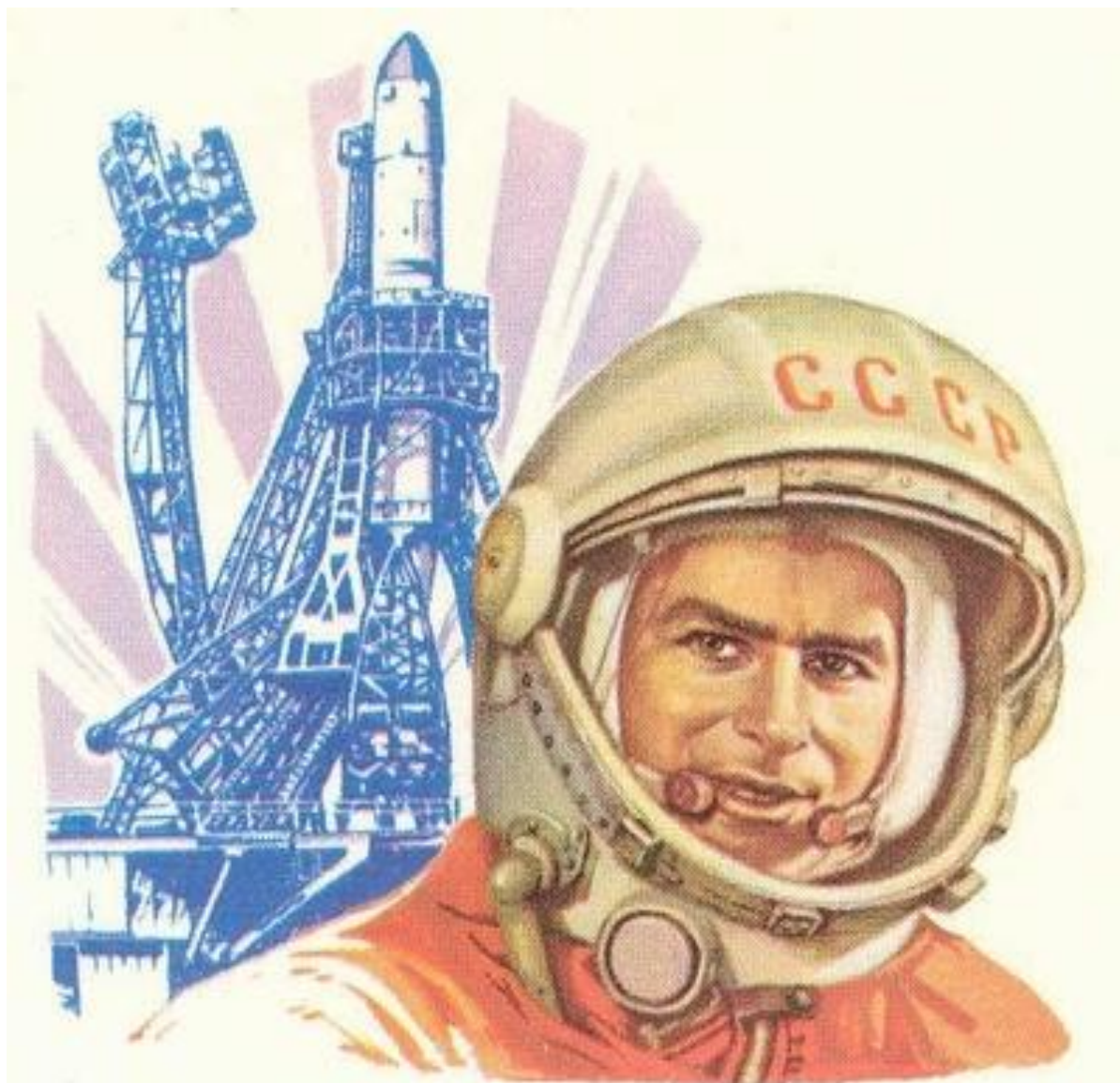
Герой Советского Союза летчик-космонавт СССР ГЕРМАН СТЕПАНОВИЧ ТИТОВ