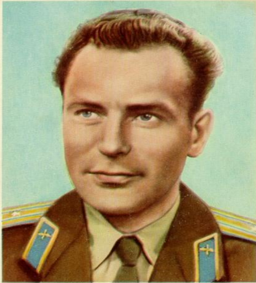
Гражданин Союза Советских Социалистических Республик летчик-космонавт Герман Степанович ТИТОВ.