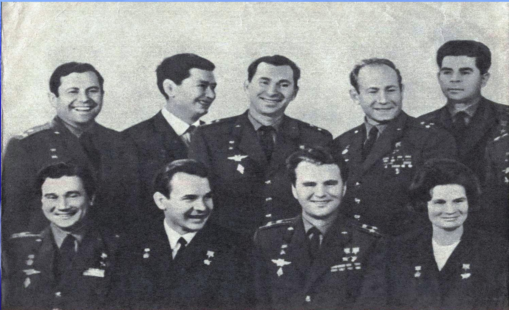
Летчики-космонавты СССР. Слева направо, в первом ряду: А. В. Филипченко, В. Н. Кубасов, В. А. Шаталов, В. В. Николаева-Терешкова, В. В. Горбатко, В. Н. Волков, Г. С. Шонин, А. С. Елисеев. Во втором ряду: П. Р. Полович, Б. Б. Егоров, П. И. Беляев, А. А. Леонов, Г. Т. Береговой, Г. С. Титов, К. П. Феоктистов,