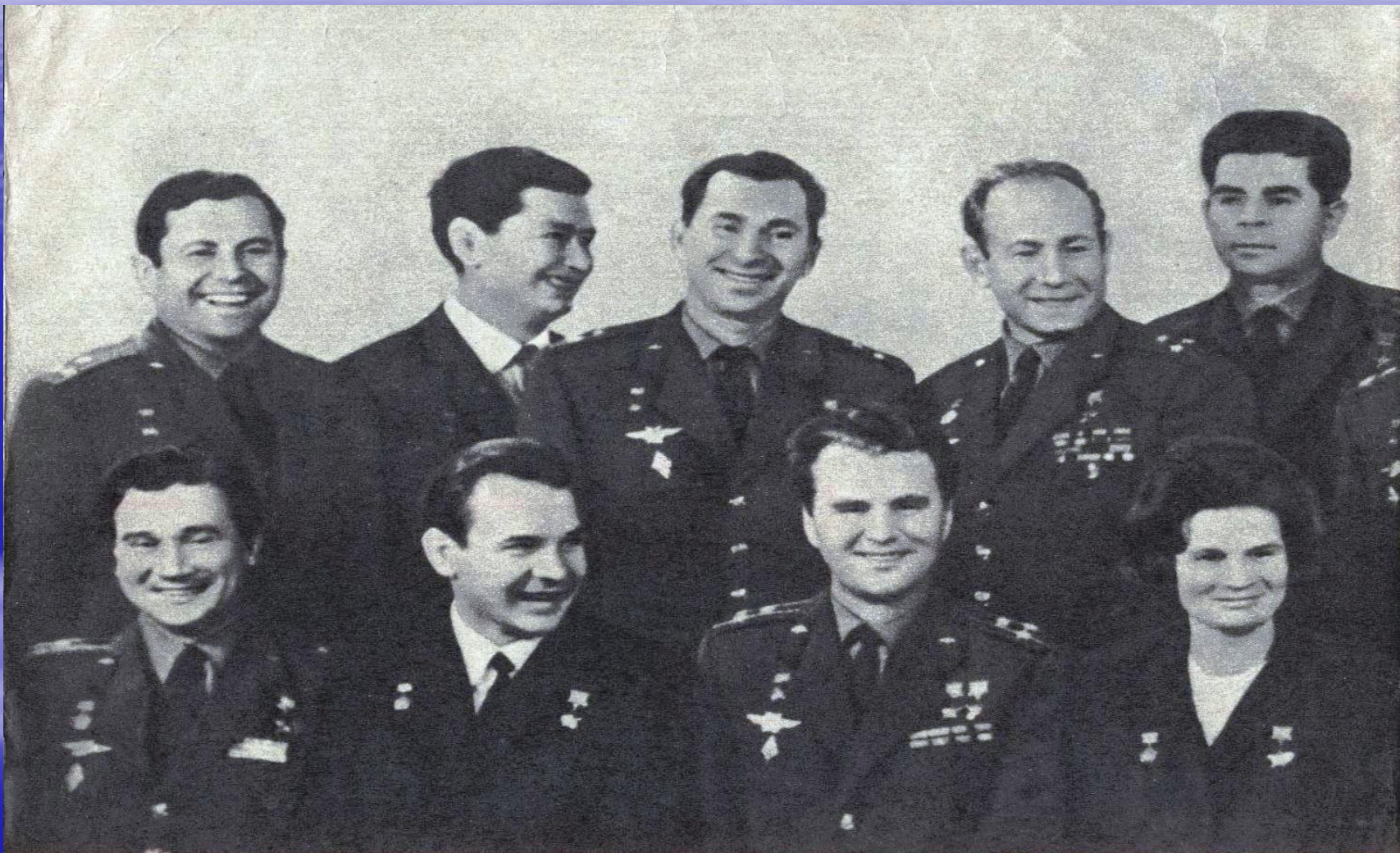
Летчики-космонавты СССР. Слева направо, в первом ряду: А. В. Филипченко, В. Н. Кубасов, В. А. Шаталов, В. В. Николаева-Терешкова, В. В. Горбатко, В. Н. Волков, Г. С. Шонин, А. С. Елисеев. Во втором ряду: П. Р. Полович, Б. Б. Егоров, П. И. Беляев, А. А. Леонов, Г. Т. Береговой, Г. С. Титов, К. П. Феоктистов,