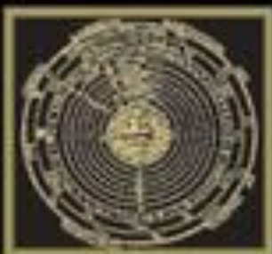
Гравюра XVI в.