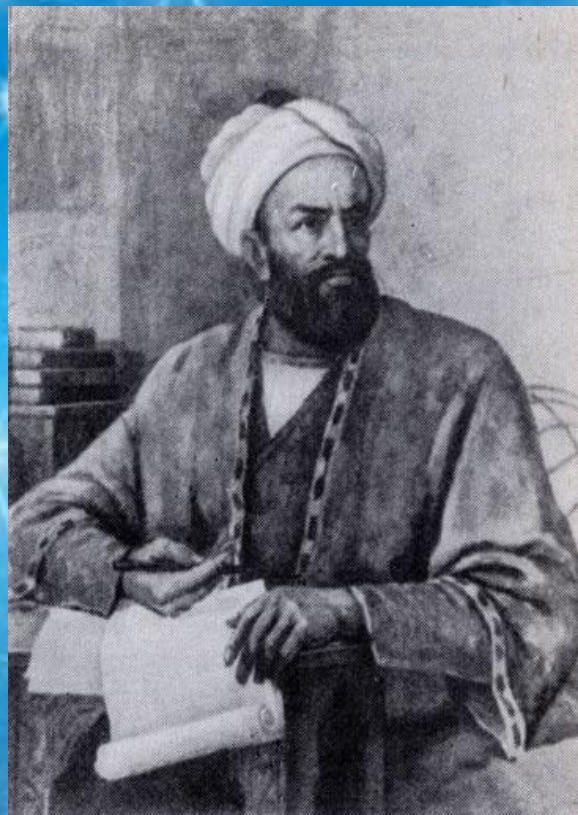
Бируни (973-1048 гг.)