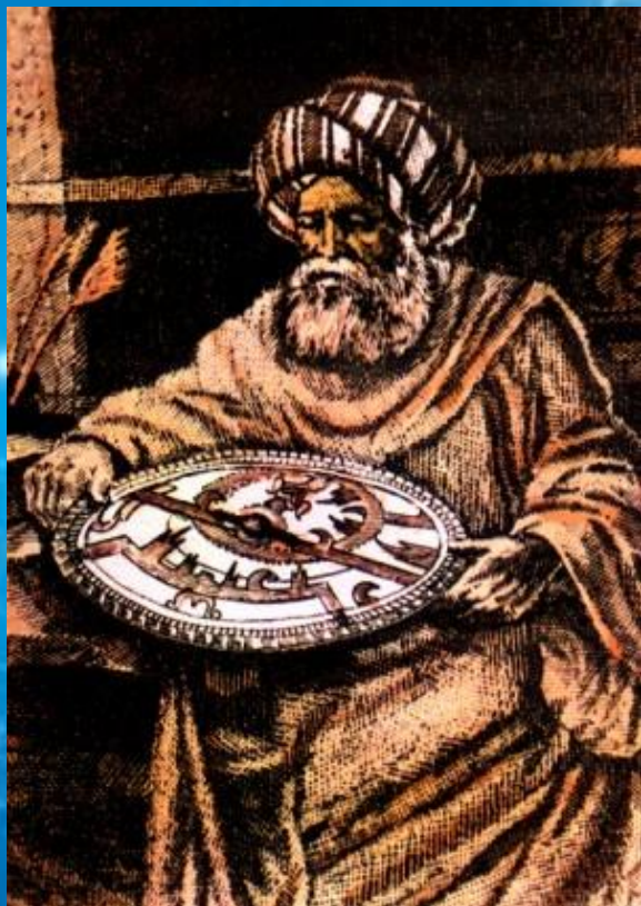
Аль-Баттани (850-929 гг.)

Рациональное развитие в этот период астрономия получила лишь у арабов и народов Средней Азии и Кавказа, в трудах выдающихся астрономов того времени.