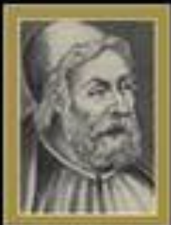
ПТОЛЕМЕЙ Клавдий (II в. н. э.)