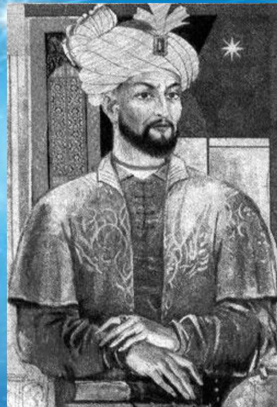
Улугбека (1394-1449 гг.)