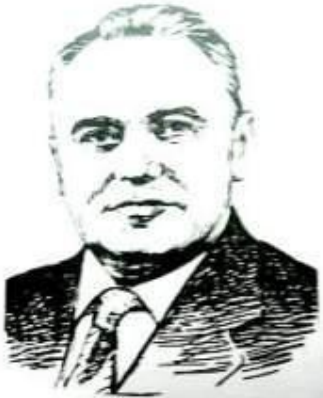
С. П. Королев