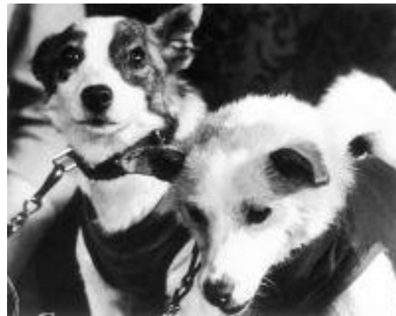
БЕЛКА И СТРЕЛКА.

Памятник Лайке открыли в Москве 11 апреля 2008г.