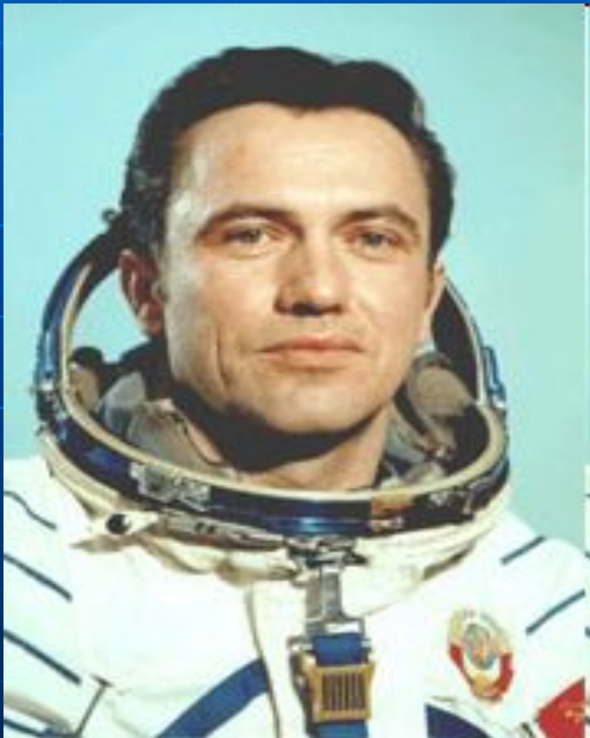
Попов Леонид Иванович, летчик-космонавт СССР, полковник.

Четыре экспедиции посещения, три из которых — международные экипажи