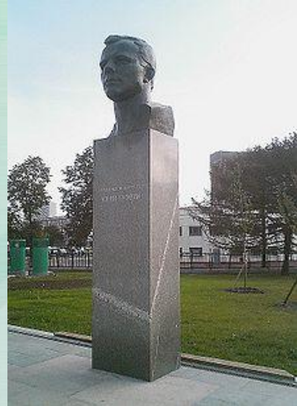
Памятник Юрию Гагарину на аллее Космонавтов в Москве