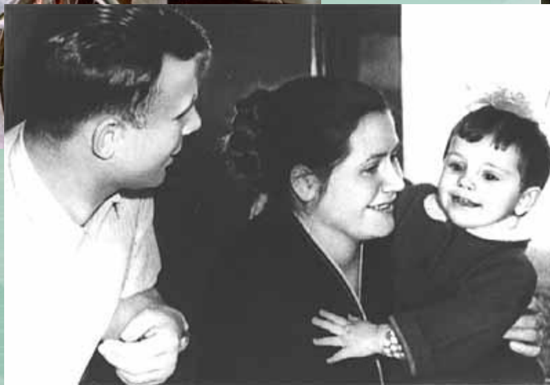
Ю.А. и В.И. Гагарины с дочкой Леной