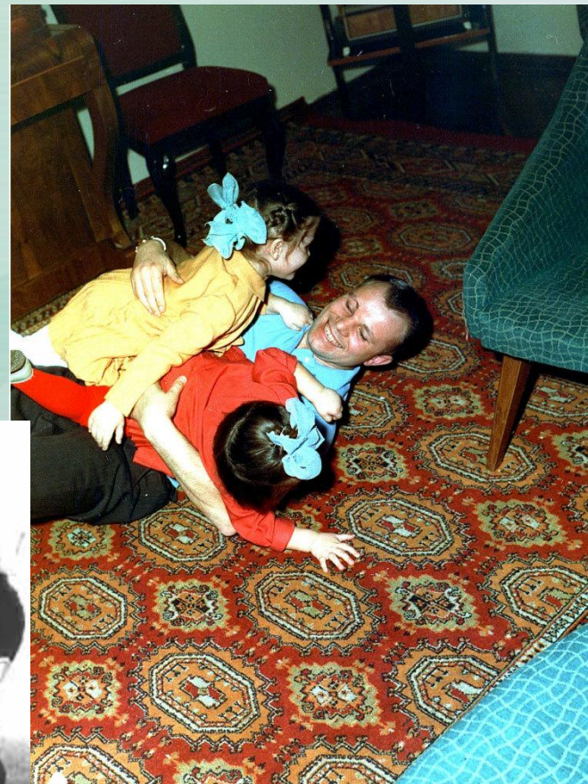
Гагарин с дочерьми Галей и Леной, Звездный городок, 1963 год