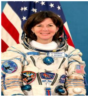
Кетрин Грейс Колман 05.04.11. – запуск «Союз – ФГ»