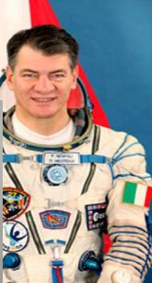
Паоло Анжело Несполи