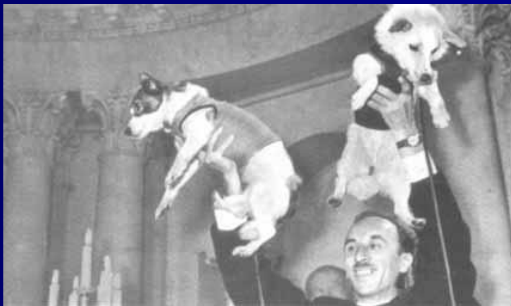
Белка и Стрелка после полёта .

Белка и Стрелка стали всеобщими любимцами. Их возили по детским садам, школам, детским домам. Журналистам на пресс-конференциях давали возможность собачек потрогать, но предупреждали: как бы ненароком не цапнули.