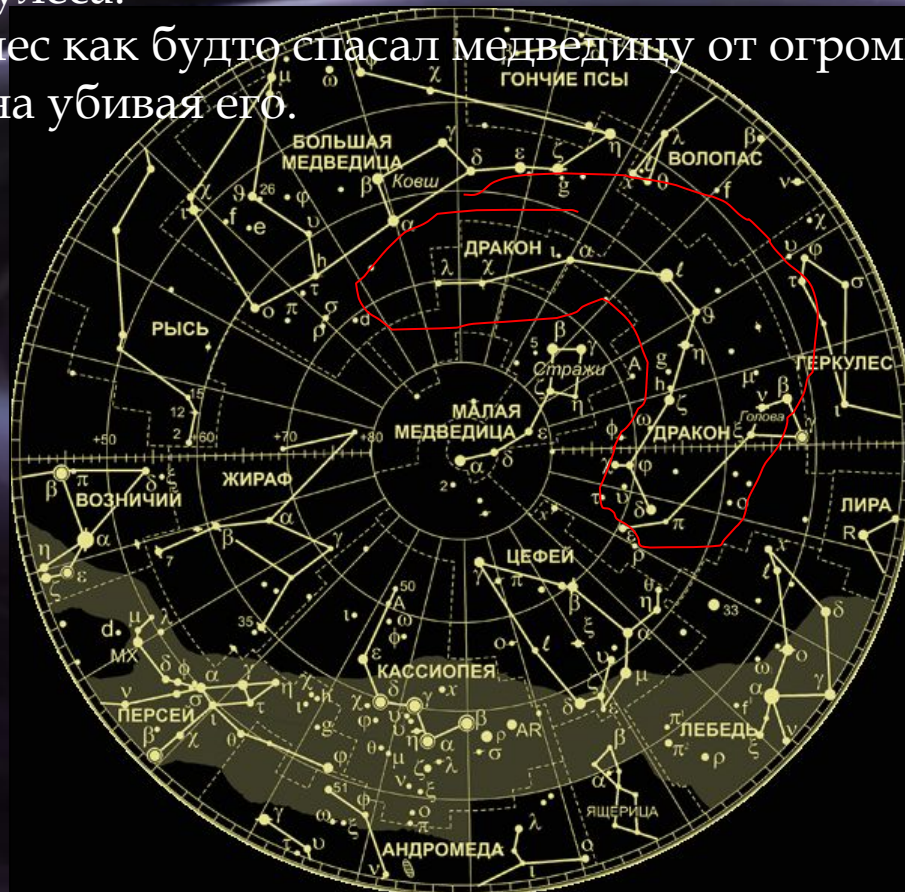
Карта звёздного неба

Геркулес как будто спасал медведицу от огромного дракона убивая его.