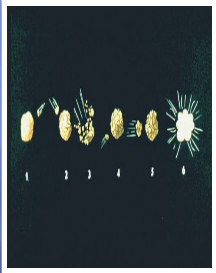
Схема образования мелких небесных тел в результате столкновения двух астероидов различной величины, которые могут стать метеоритами, упав на Землю.