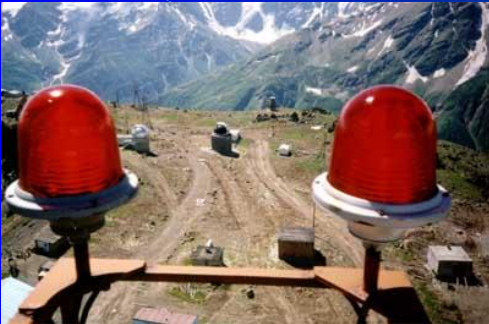
Малые телескопы на пике Терскол