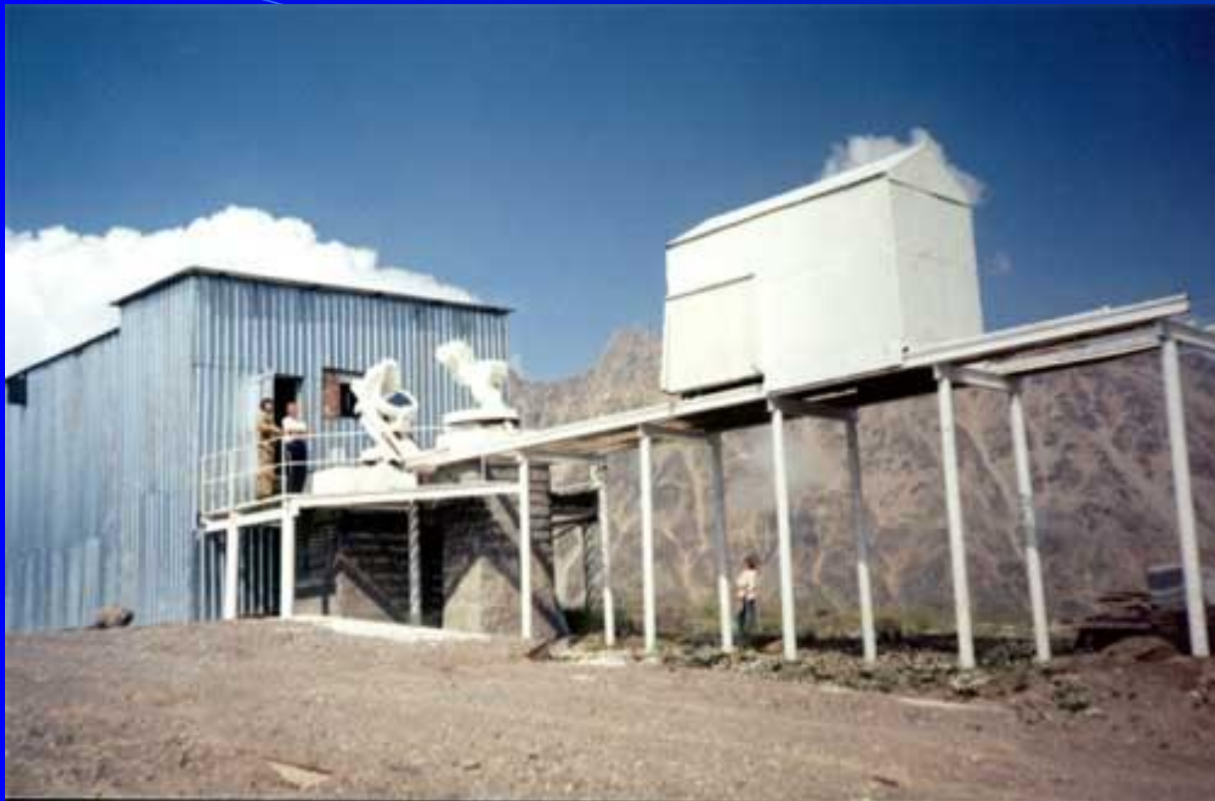
Солнечный телескоп АЦУ-26