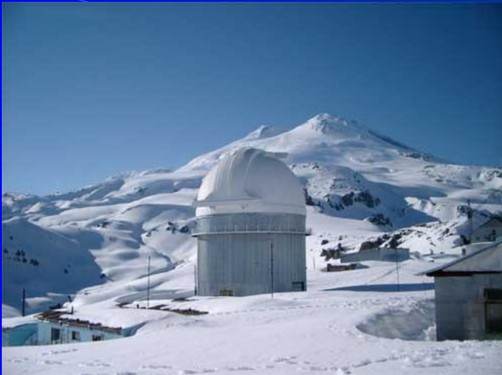
Обсерватория на пике Терскол