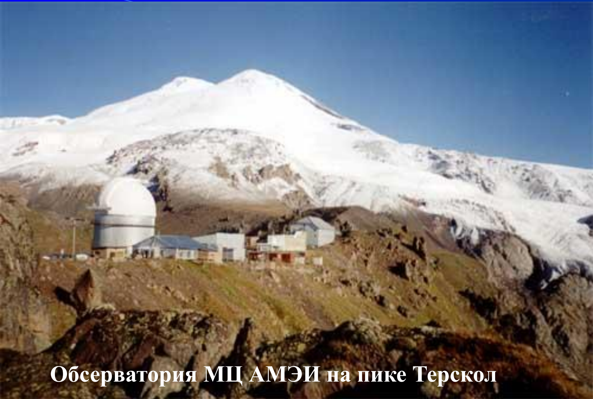
Обсерватория МЦ АМЭИ на пике Терскол