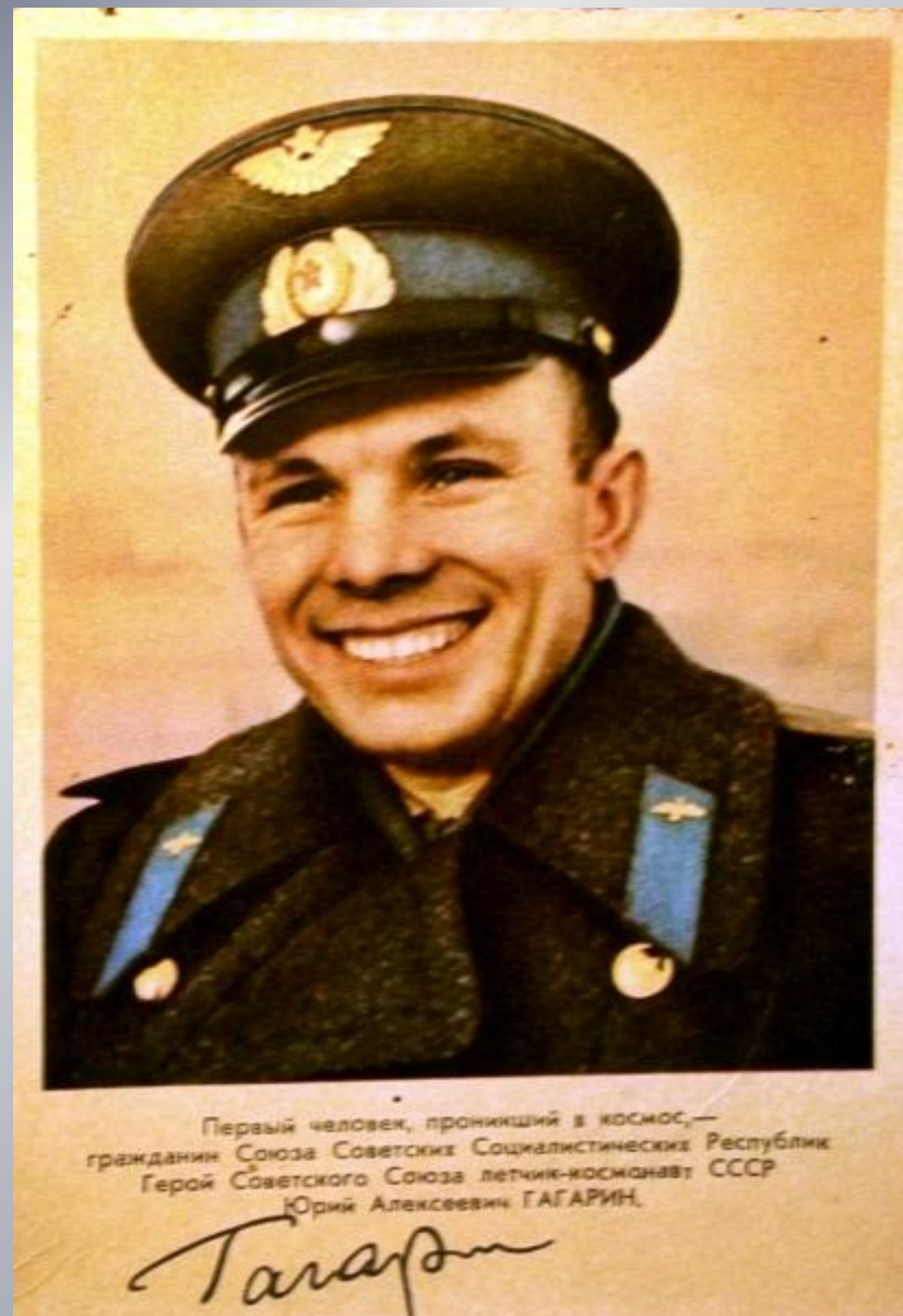
Первый человек, проникший в космос, — гражданин Союза Советских Социалистических Республик Герой Советского Союза летчик-космонавт СССР Юрий Алексеевич ГАГАРИН.

Не попросив подмог ни у кого, Сама восстав из пепла и из праха, Моя страна, не знающая страха, Шлет в космос ныне сына своего.