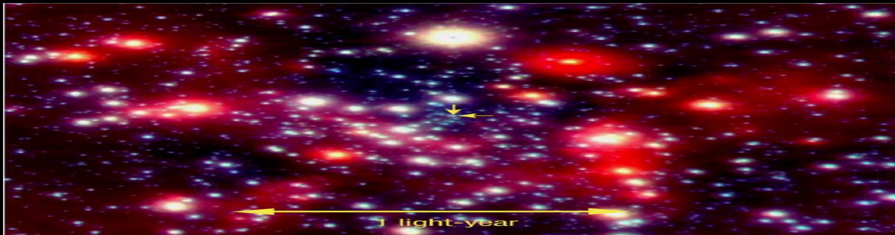
The Centre of the Milky Way (VLT YEPUN + NACO)