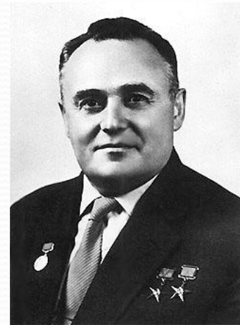
Сергей Павлович Королёв

● Сергей Павлович Королёв – российский конструктор и ученый под руководством которого были созданы первый искусственный спутник земли и пилотируемые космические корабли. Огромный вклад в изучении космоса внес Константин Эдуардович Циолковский . Он был первым из современных ученых, кто серьезно заговорил о полетах в космос и начал делать по этому поводу научные вычисления.