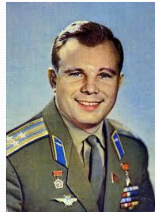
Юрий Алексеевич Гагарин