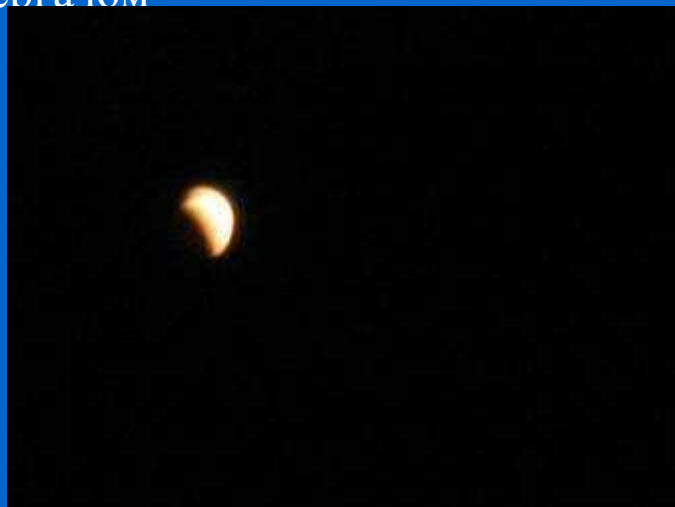
Лунное затмение (частное) 16 -17 августа 2008г.