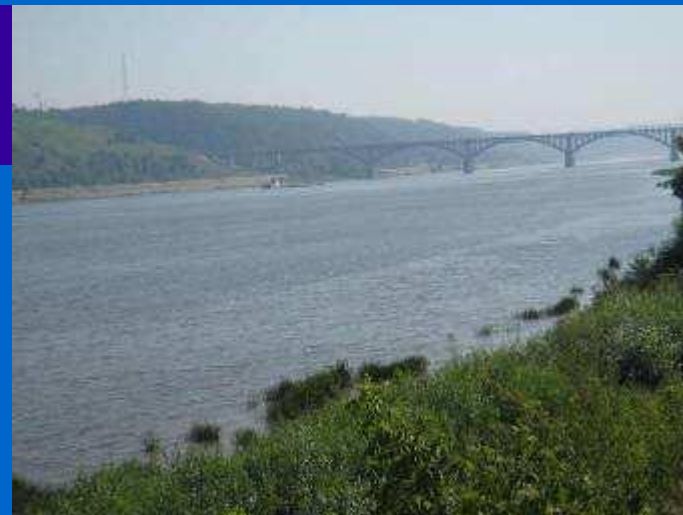
Вид на окский мост от планетария