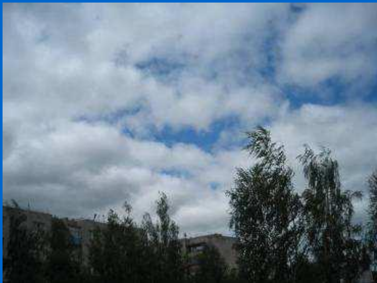
Небо над Сергачом