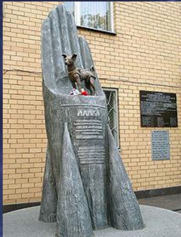
Памятник Лайке на территории Института военной медицины

Эксперимент подтвердил, что живое существо может пережить запуск на орбиту и невесомость.