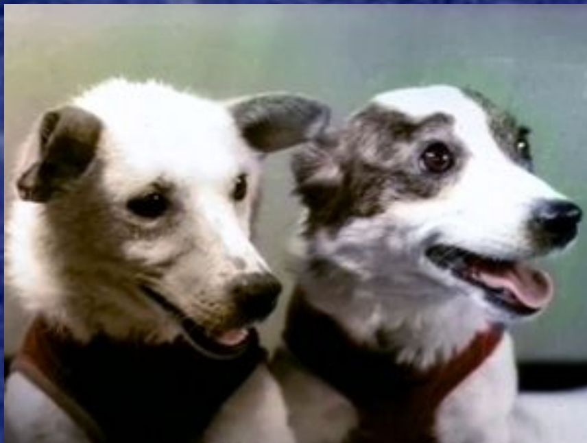
Собаки-комонавты Белка и Стрелка