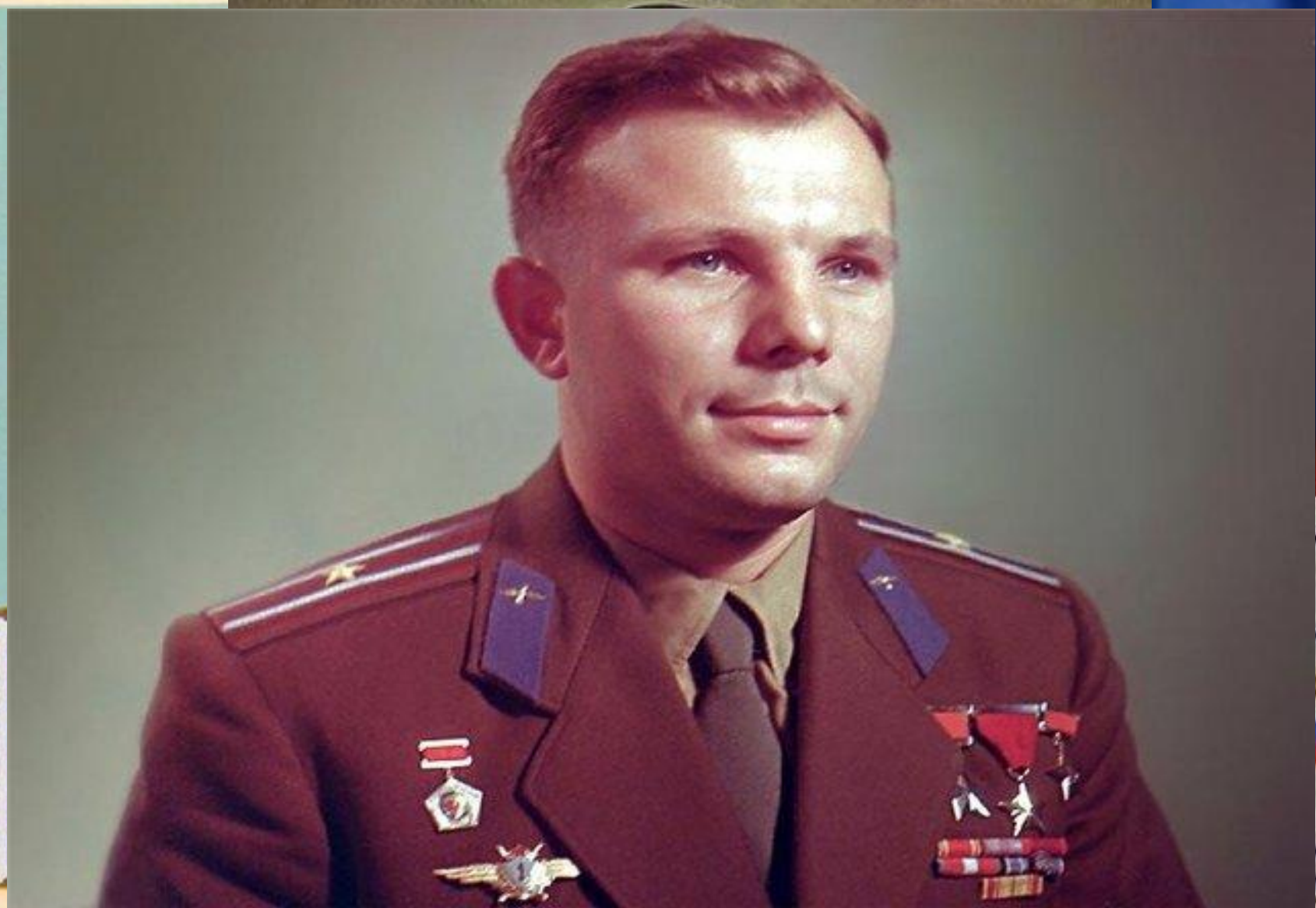
Гражданин Союза командир корабля «Союз», дитина космонавту подполковник Борис Валентинович ВОЛЬНОВ.